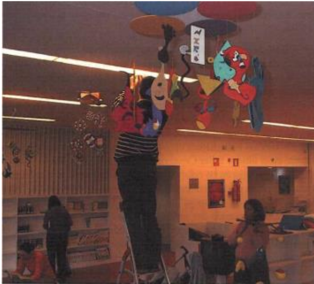
"Recordando a Miró", uno de los padres de los móviles junto a Calder

El arte es una espada de Damócles sin filo que no mata, quizás por eso los móviles, sean colgantes o estáticos, no tengan peligro alguno, salvo quedar fascinados y luego prisioneros del color y de las formas.