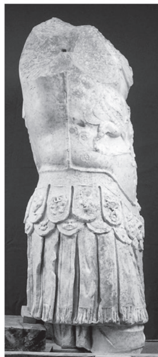
Figura 1. Estatua militar hallada en la basílica de Segobriga. a: frente; b: dorso; c: lateral izquierdo; d: lateral derecho (de Noguera, Abascal, Cebrián 2008).