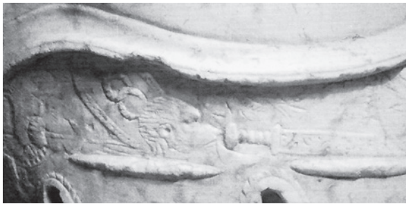
Figura 3. Detalle de la cenefa labrada con congeries armorum (de Noguera, Abascal, Cebrián 2008).

XIII Gemina 26 . En cuarto y último lugar, como ya señaló R. Gergel, la doble cabeza de carnero podría hacer alusión al emblema de la legión I Flavia Minervia Pia Fidelis Domitiana 27 , creada en el año 83 d. C. por el emperador Domiciano y, posiblemente, participante también en la campaña de Domiciano contra los sármatas 28 .