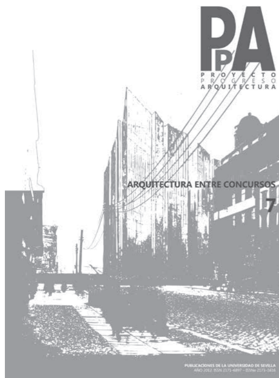
PPA N07 ARQUITECTURA ENTRE CONCURSOS (AÑO III, noviembre 2012)