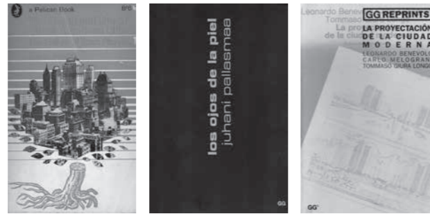
PPA N04: Jane Jacobs: MUERTE Y VIDA DE LAS GRANDES CIUDADES – Juhani Pallasmaa: LOS OJOS DE LA PIEL. LA ARQUITECTURA DE LOS SENTIDOS – Leonardo Benevolo et al: LA PROYECCIÓN DE LA CIUDAD MODERNA