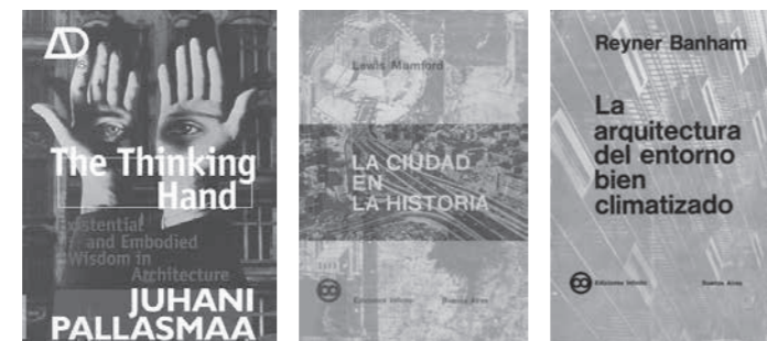
PPA N06: Juhani Pallasmaa: THE THINKING HAND: EXISTENTIAL AND EMOBODIED WISDOM IN ARCHITECTURE – Lewis Mumford: LA CIUDAD EN LA HISTORIA. SUS ORÍGENES, TRANSFORMACIONES Y PERSPECTIVAS – Reyner Banham: LA ARQUITECTURA DEL ENTORNO BIEN CLIMATIZADO