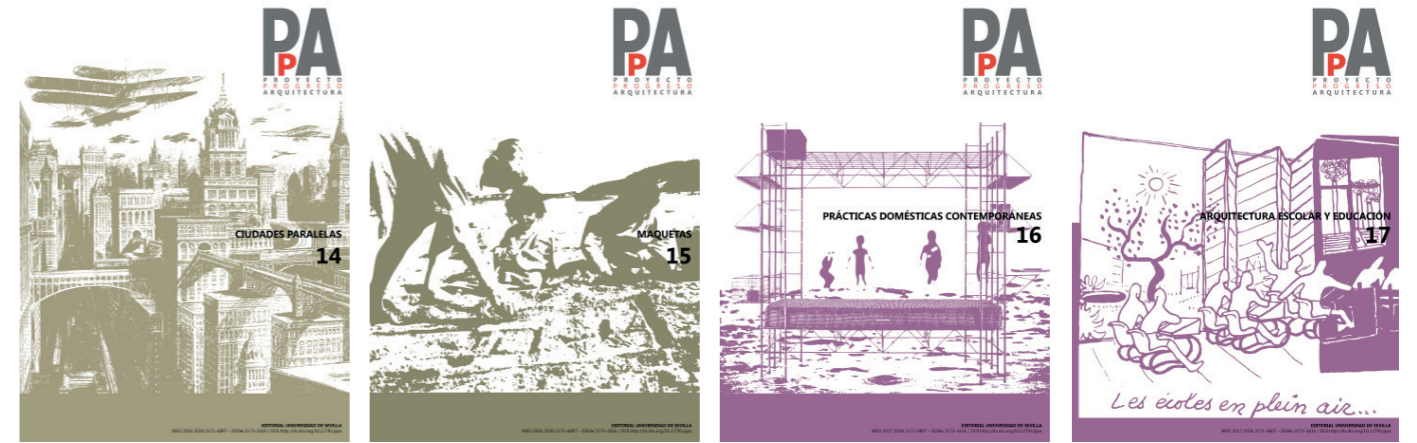
PpA N14 N14. CIUDADES PARALELAS (mayo, 2016) / N15. MAQUETAS (noviembre 2016) / N16. PRÁCTICAS DOMÉSTICAS CONTEMPORÁNEAS (mayo 2017) / N17. ARQUITECTURA ESCOLAR Y EDUCACIÓN (noviembre 2017)