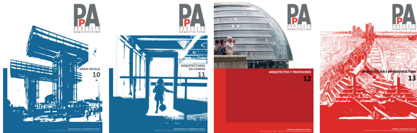
PpA N10 N10. GRAN ESCALA (mayo 2014) / N11. ARQUITECTURAS EN COMÚN (noviembre 2014) / N12. ARQUITECTOS Y PROFESORES (mayo 2015) / N13. ARQUITECTURA E INFRAESTRUCTURA (noviembre 2015)