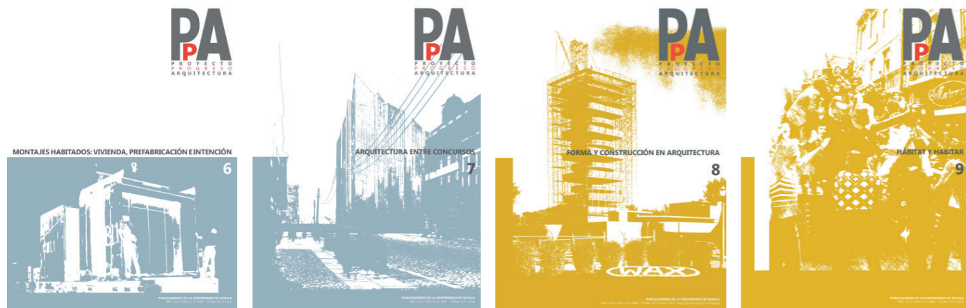
PpA N06 N06. MONTAJES HABITADOS: VIVIENDA, PREFABRICACIÓN E INTENCIÓN (mayo, 2012) / N07. ARQUITECTURA ENTRE CONCURSOS (noviembre 2012) / N08. FORMA Y CONSTRUCCIÓN EN ARQUITECTURA (mayo 2013) / N09. HÁBITAT Y HABITAR (noviembre 2013)