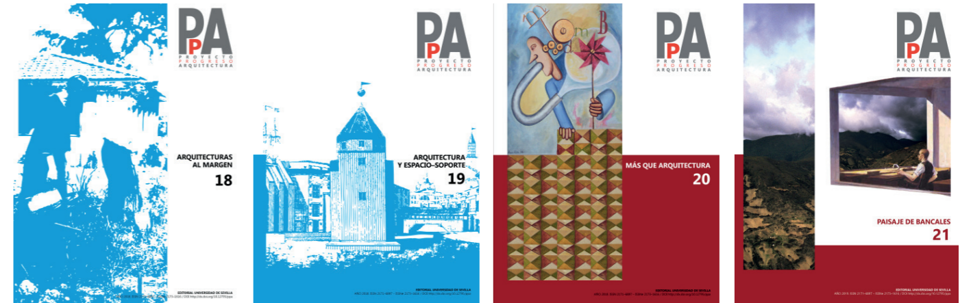
PpA N18 N18. ARQUITECTURAS AL MARGEN (mayo, 2018) / N19. ARQUITECTURA Y ESPACIO-SOPORTE (noviembre, 2019) / N20. MAS QUE ARQUITECTURA (mayo, 2019) / N21. PAISAJE DE BANCALES (noviembre 2019)