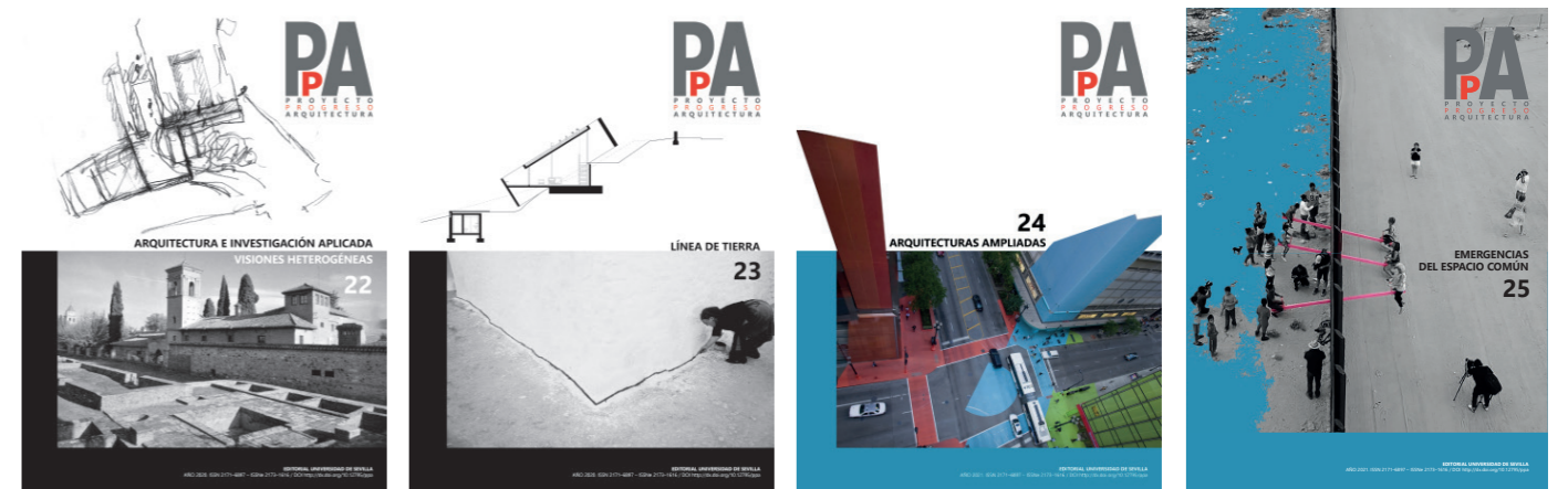
PpA N22 N22. ARQUITECTURA E INVESTIGACIÓN APLICADA. VISIONES HETEROGÉNEAS (mayo, 2020) / N23. LÍNEA DE TIERRA (noviembre 2020) / N24. ARQUITECTURAS AMPLIADAS (mayo 2021) / N25. EMERGENCIAS DEL ESPACIO COMÚN (noviembre 2021)