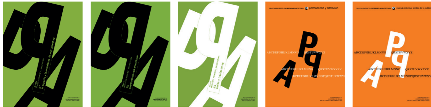
PpA N01 N01. EL ESPACIO Y LA ENSEÑANZA DE LA ARQUITECTURA (mayo, 2010) / N02. SUPERPOSICIONES AL TERRITORIO (mayo 2010) / N03. VIAJES Y TRASLACIONES (noviembre 2010) / N04. PERMANENCIA Y ALTERACIÓN (mayo 2011) / N05. VIVIENDA COLECTIVA: SENTIDO DE LO PÚBLICO (noviembre 2011)