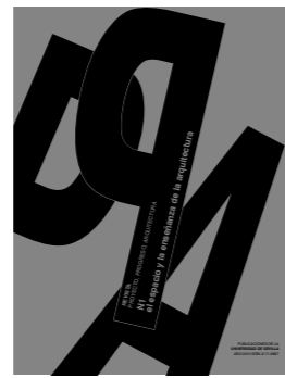
PPA N01. EL ESPACIO Y LA ENSEÑANZA DE LA ARQUITECTURA (AÑO I, mayo 2010 – ed. conjunto N2)