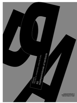
PPA N02. SUPERPOSICIONES AL TERRITORIO (AÑO I, mayo 2010 – ed. conjunto N1)