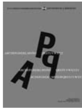
PPA N04. PERMANENCIA Y ALTERACIÓN. (AÑO II, mayo 2011)