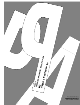
PPA N03. VIAJES Y TRASLACIONES (AÑO I, noviembre 2010)