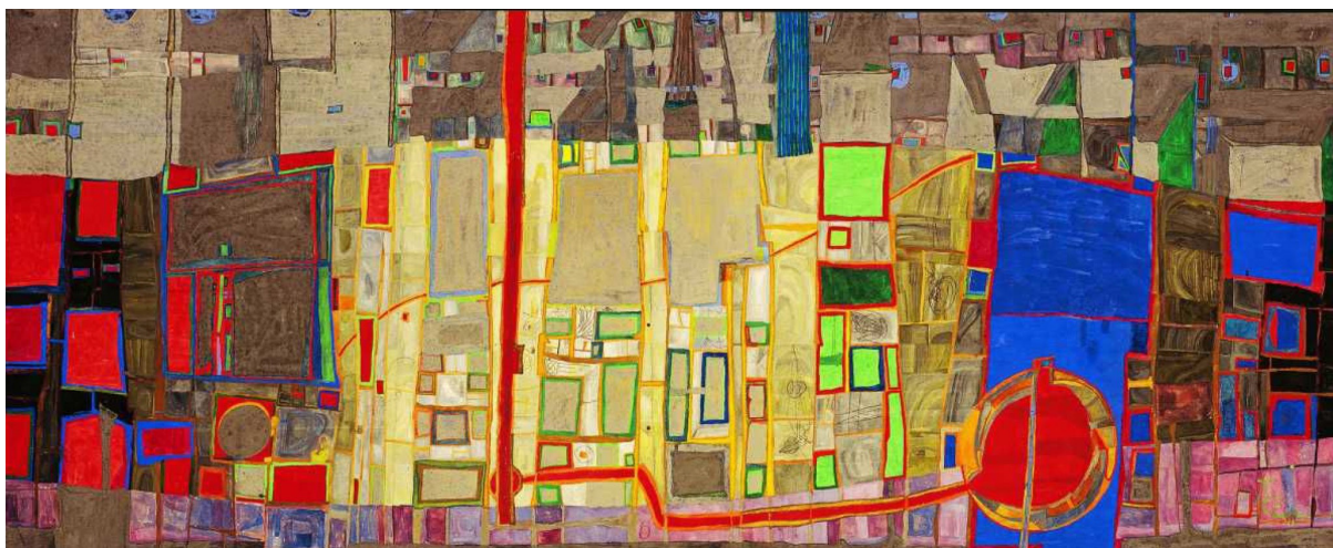
Figura 3. La cite die stadt . Friedensreich Hundertwasser, 1953. Österreichische Galerie, Belvedere, Viena.

Con respecto a ello, la autora afirmaba que “no sigo una unidad temática ni un orden estricto, sino que pinto fundamentalmente por las noches, medio dormida, dejando que las ideas y los trazos fluyan libremente” . 8 “Mis obras son una interpretación de lo que veo y lo que siento, juego mucho con la creatividad no copio la realidad” . 9