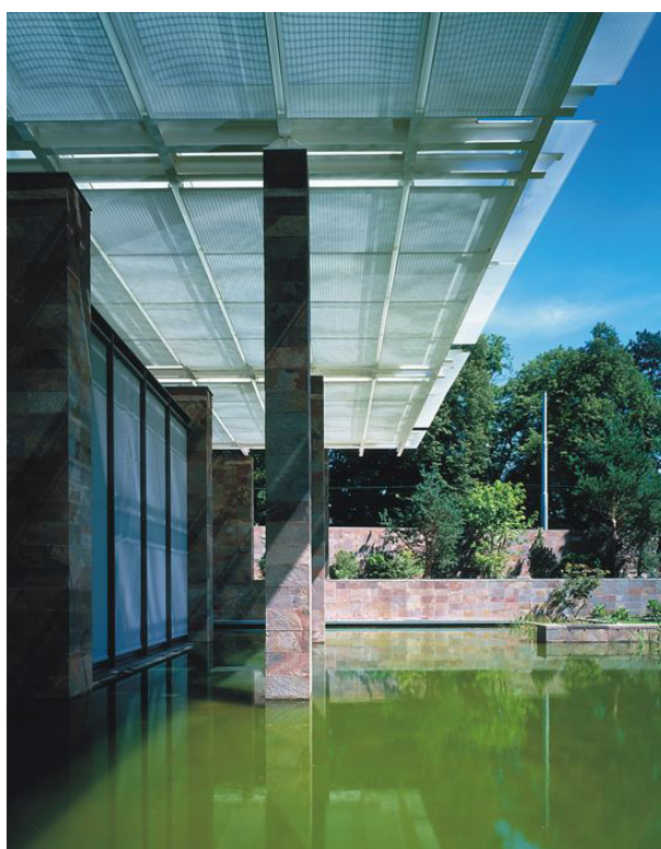
Fig. 5. La arquitectura puede ser sensualmente tectónica y poética. Renzo Piano, Fundación Beyeler, Suiza, 1997. Este museo ofrece, para Pallasmaa, una ideal condición para la contemplación del arte.

La arquitectura no puede surgir de algoritmos, sino de la empatía y de la imaginación humana 28 . Se debe evitar la enseñanza y la práctica de la arquitectura como si fuera la resolución de problemas matemáticos para dar lugar a soluciones eficientes (Fig. 5). Igualmente se debe evitar valorar la arquitectura desde su lado exclusivamente estético o idealizado 29 .