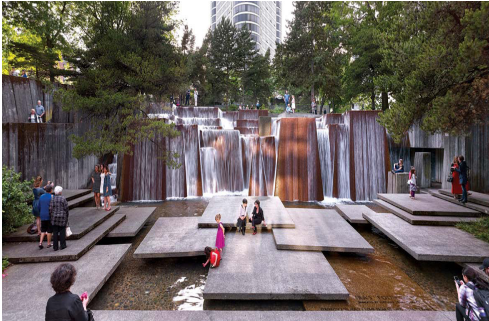
Fig. 3. Auditorium Forecourt Plaza, Oregón, Estados Unidos, 1961, obra de Lawrence Halprin. Pallasmaa llama la atención sobre cómo esta fuente artificial se ha integrado en la atmósfera natural discretamente.

Debemos volver a confrontar la arquitectura con nuestro cuerpo, que es quien la atraviesa. Además, los edificios no sólo albergan nuestros cuerpos, sino también nuestras mentes, recuerdos, deseos y sueños. Por eso está tan arraigada la sensación de que la arquitectura es una extensión de nosotros mismos.