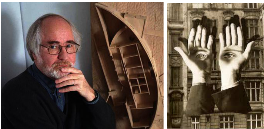
Figs. 1 y 2. Pallasmaa, fotografía actual, y El metropolitano solitario , de Herbert Bayer, 1932. La obsesión contemporánea por el sentido de la vista impide una experiencia vivencial completa.

Hay una suerte de tendencia a la deshumanización en la arquitectura y de eso se ha dado cuenta la crítica actual, dentro de la cual Pallasmaa es uno de los principales defensores de una ciudad más humana. En efecto, su mensaje es que hay que apostar por dar más emotividad a la arquitectura, y explorar la capacidad de los edificios para acoger y enriquecer la vida.