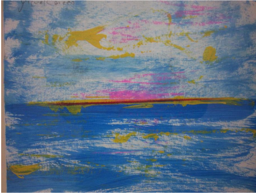
Marina, paisaje de Marruecos