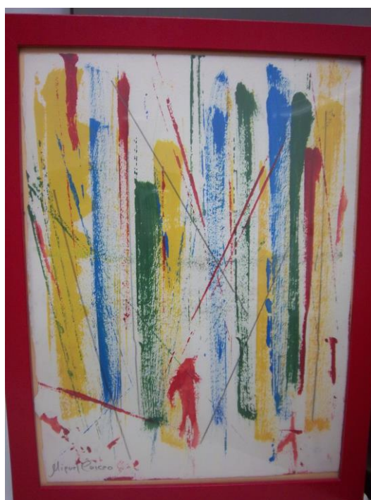
Juego de líneas