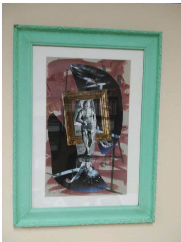
Homenaje a Picasso