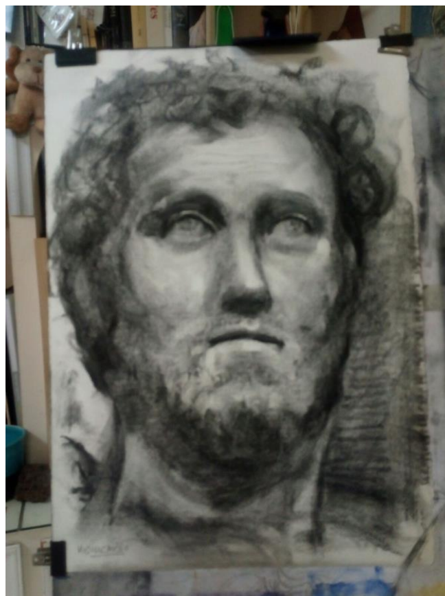
Estudio de busto clásico