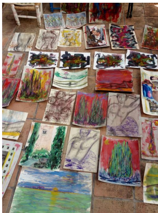
Vista panorámica de varias obras de pequeño formato