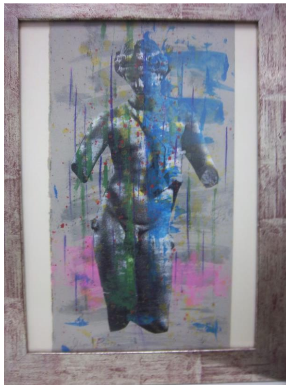
Homenaje a la cultura clásica