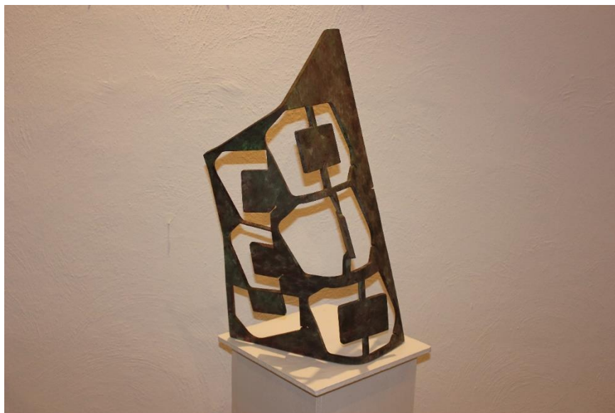
Antonio Polo. Formas geométricas II.