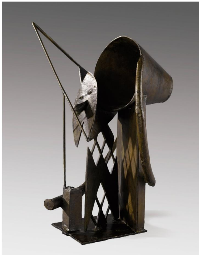
Julio González. El Arlequín. 1930.

En este sentido podemos incluir una tercera obra, de unas cualidades plásticas exquisitas y una de las más famosas del artista. Se trata del Arlequín 91 , y para su comentario, podemos retrotraernos a la obra que con el mismo título, ejecutara Julio González en 1930 92 . Eso sí, Polo trata el mismo asunto de forma mucho más simplificada. Pese a que el mensaje es claro, la depuración formal empieza a hacerse cada vez más latente. La de González se aproxima muchísimo a la abstracción, empleando un lenguaje mucho más complejo en el que el título, es cuanto menos imprescindible para comprender lo que ocurre. Polo se apoya en una estructura simple, frontal, donde el cromatismo negro y los espacios vacíos se aúnan para evocarnos el atuendo de estos cómicos personajes.