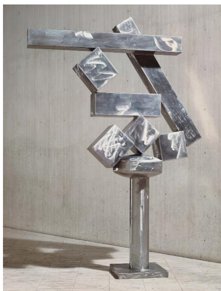
Una de las obras conformadas por Cubos de David Smith, entre 1962 y 1964.