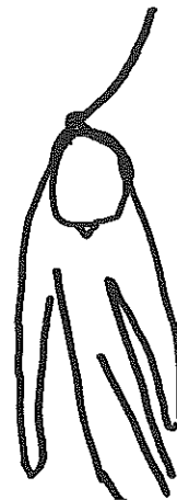
Ilustración: Mechelin van der Heijden

horror vivido antes de ser atacados, se habla poco.