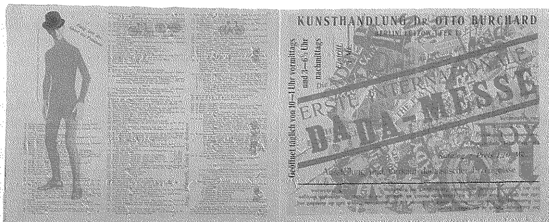
Catálogo de la primera Feria Internacional Dada, Berlín 1920. Maqueta de John Heartfield y George Grosz

Como se observa son tantos los problemas que el profesorado consciente de que hace falta cambiar la situación empieza a interesarse por el establecimiento de contactos con otras Escuelas. En 1991 hay un primer encuentro en Chiclana de la Frontera con el fin de recopilar información sobre la situación de las EE.OO.II.