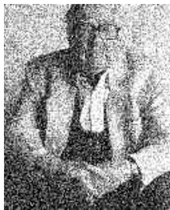
Bild ansehe, desto weniger ist er es. Das ist keine Ausrede. Er war in Chile und nicht in Stutthof, und damit ist unser Verdacht sinnlos geworden.

Der Verdacht , 1951, presenta muy poco en común con la estructura de las tradicionales novelas policíacas que parten de un esquema lógico y ordenado. De hecho la pura casualidad es la que da lugar al inicio de la investigación.