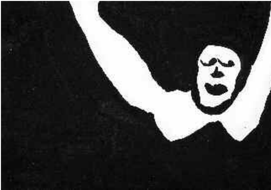
Ilustración: Mechelin van der Heijden

tros días. El público comparte deseos de venganza con el protagonista que se asientan en un suceso conocido. Según la incisiva mirada de Haneke, la violencia tratada de una forma justa convierte la película en un objeto insoportable. El control de la violencia en el cine es el único posible. Para desmontar este argumento, Haneke nos hace confundir ficción con realidad y nos ofrece una ficción que tampoco logra mantener la violencia bajo control. No da tregua al espectador. El maltratador rebobina la cinta en Funny Games y hace valer su propósito, no permite un desenlace esperanzador al menos para uno de los personajes. Pues si sucede en la ficción, será real, ya que es delgada la línea que une ambos mundos como queda patente en la conversación final entre los dos torturadores en la barca: «La ficción es real ¿no?» Si lo ves en una película es tan real como la realidad que ves. No se trata de pesimismo sino de realismo en palabras del propio director. Tratar de encontrar una explicación lógica a la violencia carece de sentido. Ante la desesperada pregunta de las víctimas a sus torturadores de «¿Por qué hacéis esto?», no pueden más que responder un «¿Por