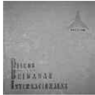
Die Mappe enthält drei Schellacks mit insgesamt sechs Liedern. Ernst Busch nahm sie während des Spanischen Bürgerkriegs 1937 im Odeon-Studio in Barcelona auf. Er publizierte die Lieder der Internationalen Brigaden darüber hinaus auch in Buchform.

selten relevant, doch geben sie perspektivenreich und vielschichtig Auskunft über das Leben der unterschiedlichen deutschsprachigen Brigaden. Bereits 1938 erschien in einem spanischen Verlag die von Alfred Kantorowicz herausgegebene Sammlung Tschapajew. Das Bataillon der 21 Nationen , in dem das Schicksal dieses multinationalen, zur XIII. Brigade gehörenden Bataillons von