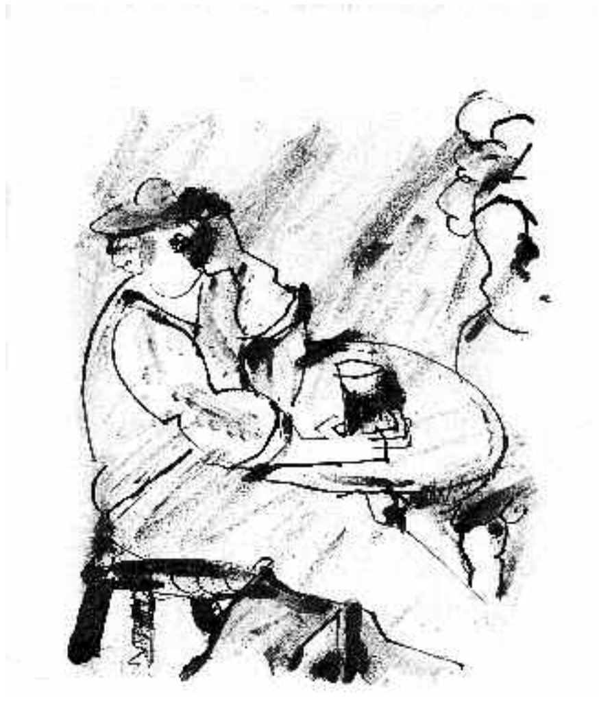
Ilustración: Mechelin van der Heijden

Das größte Interesse für Deutsch findet sich in den Regionen