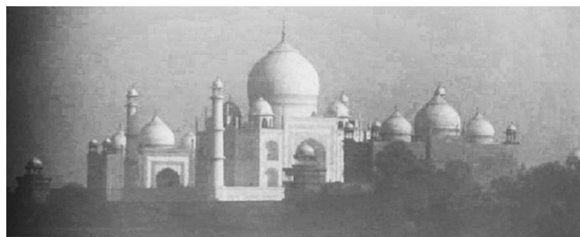
Abbildung 4: Fotogramm „Taj Mahal“

In dieser Szene sehen die beiden Brüder Salim und Jamal zum ersten Mal in ihrem Leben das Taj Mahal. In der englischen Bildbeschreibung wird dieses Gebäude sofort identifiziert (Identifikation) und mit dem Zusatz „majestic white marbled palace“ beschrieben. In der deutschen Hörfilmfassung wird zunächst nur von einem weißen palastartigem Gebäude gesprochen; erst im zweiten Teil der Beschreibung werden die Türme und Kuppeln des Taj Mahal genannt. Das Taj Mahal kann