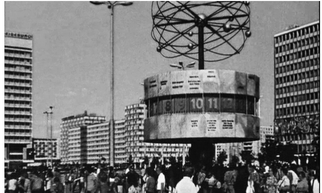
Abbildung 6: Fotogramm «Weltzeituhr»

In dieser Szene zu Beginn des Films sind Bilder Ostberlins zu sehen, wie der Alexanderplatz und die Weltzeituhr. In der deutschen Bildbeschreibung werden diese beiden Konzepte sofort anhand ihrer Bezeichnung identifiziert (Identifikation) und im Fall