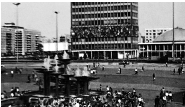
Abbildung 5: Fotogramm «Alexanderplatz».

In dieser Szene zu Beginn des Films sind Bilder Ostberlins zu sehen, wie der Alexanderplatz und die Weltzeituhr. In der deutschen Bildbeschreibung werden diese beiden Konzepte sofort anhand ihrer Bezeichnung identifiziert (Identifikation) und im Fall