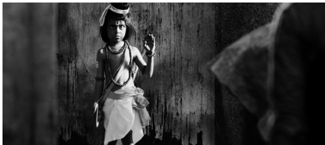
Abbildung 3: Fotogramm „Hindu Gottheit Rama“

In dieser Szene begegnen die Brüder Salim und Jamal einem kleinen Jungen, der wie der Hindugott Rama gekleidet und bemalt ist. Genau wie im ersten Beispiel ist auch dieses kulturelle Element in die Subkategorie „Concepts“ nach Newmark einzuordnen. In der englischen Bildbeschreibung wird diese Gottheit zuerst anhand ihres Namens identifiziert (Identifikation) und dann werden ergänzend die Kleidung und Bemalung beschrieben. Dies lässt darauf schließen, dass der Hindugott Rama dem britischen Publikum bekannt ist und nur sein Aussehen noch einmal in Erinnerung gerufen werden muss. In der deutschen Hörfilmfassung wird der Name Rama nicht genannt, da er beim deutschen sehbehinderten Publikum offenbar kein mentales Bild auslöst und diese indische Gottheit als für Deutsche unbekannt vorausgesetzt wird.