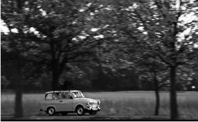
Abbildung 6: Fotogramm «Trabant».