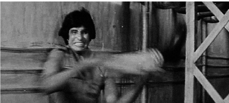
Abbildung 2: Fotogramm „Amitabh Bachchan“

In dieser Szene sind Ausschnitte aus Actionfilmen des indischen Schauspielers Amitabh Bachchan zu sehen. Diese kulturellen Elemente könnte man also der weiter oben aufgeführten Subkategorie „Concepts“ nach Newmark zuordnen. Bachchan und seine Actionfilme sind dem britischen Publikum durchaus als bekannt vorauszusetzen. In der englischen Bildbeschreibung wird deshalb der bekannte Schauspieler also durch die Nennung seines Namens identifiziert sowie auf seine Actionfilme aus den siebziger Jahren verwiesen. Das deutsche sehbehinderte Publikum hat diese Vorkenntnisse nicht. Daher wird der Schauspieler in der deutschen Bildbeschreibung zunächst beschrieben, bevor sein Name genannt wird, ebenso wie auch die Ausschnitte aus seinen Filmen, deren Kenntnis man bei einem deutschen sehbehinderten Publikum ebenfalls nicht voraussetzen kann. Der deutsche Bildbeschreiber hat also das Vorwissen eines prototypischen sehbehinderten deutschen Zuschauers berücksichtigt und im Vergleich mit der englischen Boldbeschreibung Informationen hinzugefügt, sodass bei dem deutschen sehbehinderten Zuschauer ein vergleichbarer kommunikativer Effekt ausgelöst wird wie im englischen (sehbehinderten) Zuschauer. Die angewandte Übersetzungsstrategie ist hier also die expansion , also eine erweiternde Erklärung.