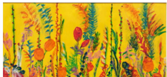
En Memoria de las Víctimas de la Covid-19 (Cris de Diego, 2020). Audiodescripción disponible en: https://crisediego.es/2020/09/17/in-memory-of-the-covid-19-victims-en-memoria-de-las-victimas-de-la-covid-19/