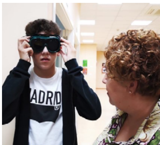
Visitante adolescente de la exposición Dibujando a Ciegas probando unas gafas de simulación de ceguera con resto de visión