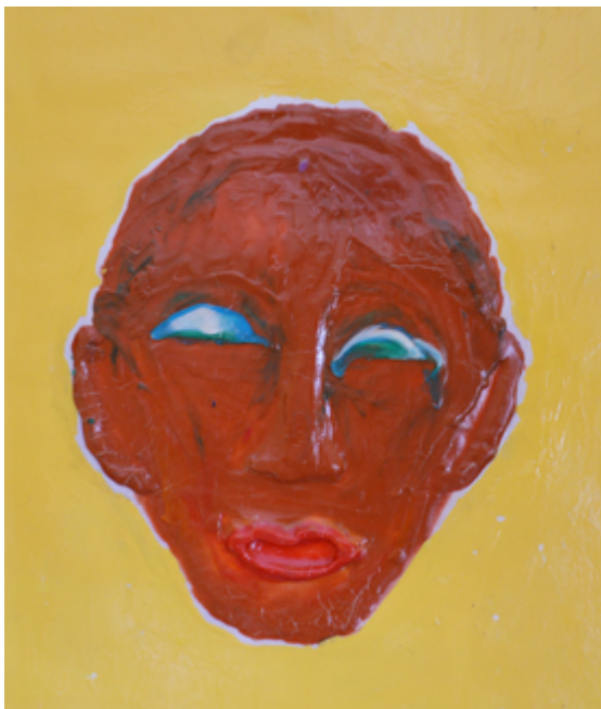
La Cara de la Ceguera (Cris de Diego, 2018). Audiodescripción disponible en: https://crisediego.es/2018/12/18/la-cara-de-la-ceguera/