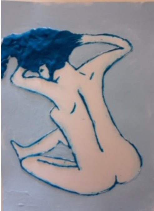
Relieve táctil de Bailarina entre Bastidores (Cris de Diego, 2018)