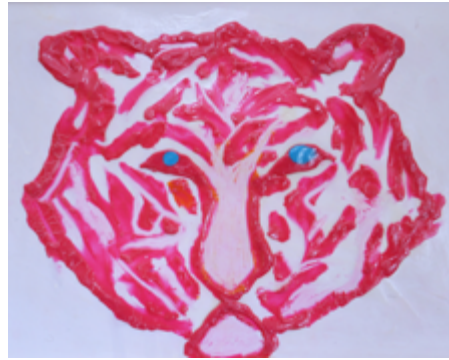
Astucia (Cris de Diego, 2018). Audiodescripción disponible en: https://crisediego.es/2018/12/09/astucia/