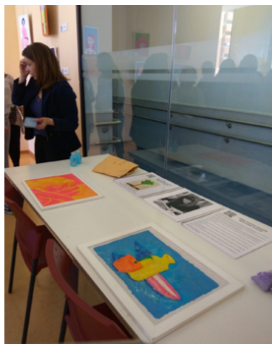
Mesa con material de apoyo táctil para ciegos en la exposición Dibujando a Ciegas : hidroalcohol para limpiar las manos antes de tocar los relieves táctiles y textos con información en tinta en alto contraste, en Braille y en audio con QR.