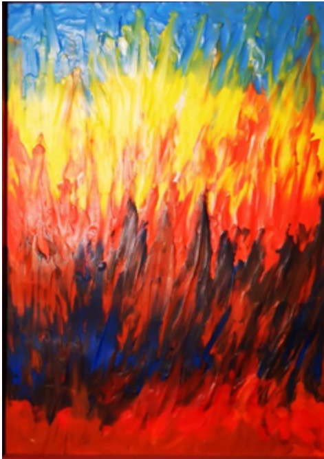
La Fuerza (Cris de Diego, 2018). Audiodescripción disponible en: https://crisdediego.es/2020/09/17/force-la-fuerza/