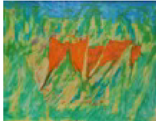
Tormenta en el Campo (Cris de Diego, 2018). Audiodescripción disponible en: https://crisediego.es/2020/09/17/storm-in-the-field-tormenta-en-el-campo/

se pueden crear cosas tan bonitas. La experiencia fue diez de diez”.