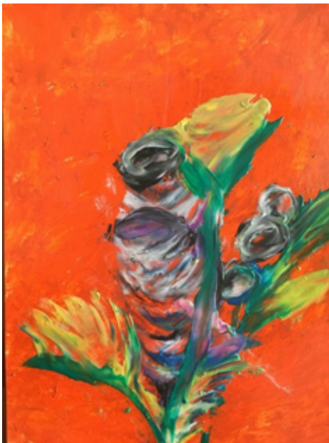
Mamá (Cris de Diego, 2019). Audiodescripción disponible en: https://crisdediego.es/2020/09/17/mum-mama/

de mis obras: Mamá, Paula de Diego, la Feminidad, La Fuerza y Tormenta en el Campo .