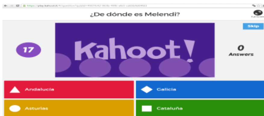
Imagen 3. Pregunta del Kahoot