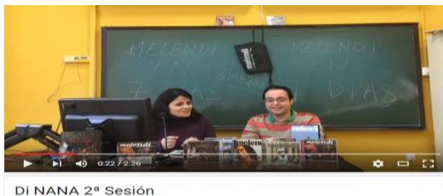
Imagen 4. Vídeo de la segunda actividad

aprendido y piden a los alumnos que describan su propio peinado y el de sus familiares. La tarea consiste en contestar vía correo electrónico, Facebook o Twitter (resulta interesante ofrecer al alumnado diversidad de posibilidades en el envío de tareas) cómo es el peinado de los siguientes personajes famosos: Bob Marley, David Beckham, la cantante Buika y el actor Brad Pitt. Se abarca solo el cambio de pelo debido a que se trata de un rasgo muy característico del cantante, quien ha tenido muchos cambios durante su etapa musical. Se aclara a los alumnos que podrán pasar al siguiente vídeo solo si han respondido bien la tarea. Los profesores se despiden hasta el siguiente vídeo.