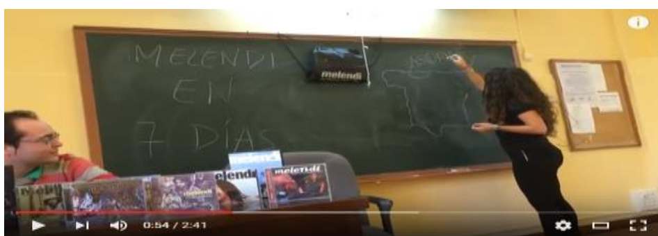
DI NANA 6ª Sesión