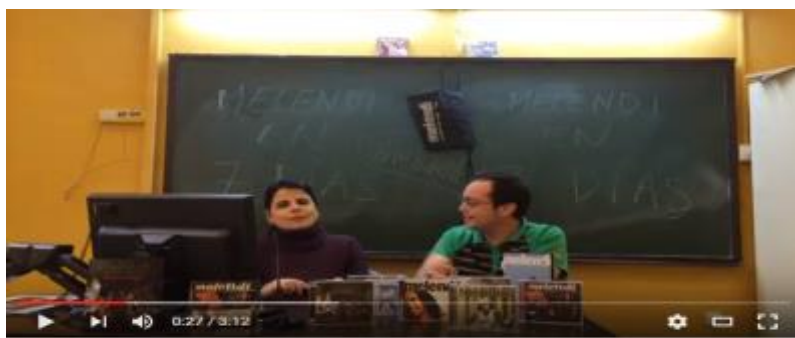
Di NANA 3ª Sesión