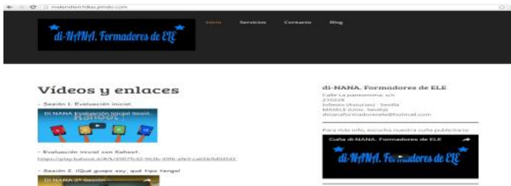
Imagen 1. Interfaz de la página web

Como propuesta didáctica, se ha creado una empresa ficticia dedicada a impartir cursos de español en línea, cuya web es http://www.melendien7dias.jimdo.com , como muestra la imagen 1: