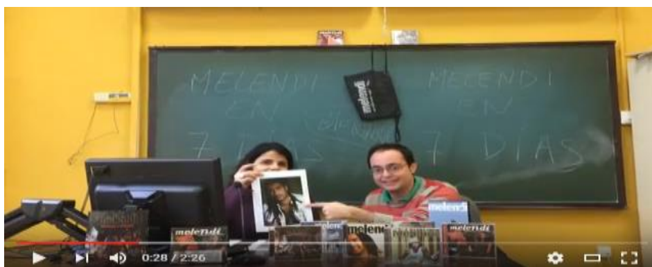
Imagen 2. Vídeo sobre los cambios de imagen

Respecto a los contenidos léxicos y gramaticales, que se trabajarán conjuntamente, destaca, en primer lugar, el hecho de acercar al alumnado al vocabulario los diferentes peinados de una persona: liso , corto , con rastas y con cresta . El alumno puede ver cómo es cada caso gracias a las fotos de los cambios de imagen del cantante Melendi, y saber que también se puede hablar de cambios en la apariencia física (imagen 2).