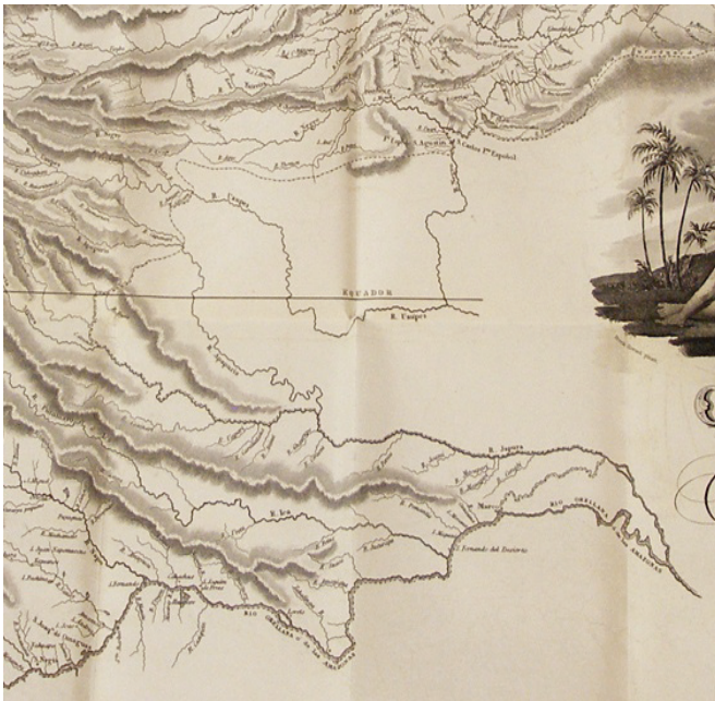
Fig. 6. “Colombia: tomado de Humboldt y otras autoridades recientes,” 1823 detalle.

bia a importantes e invaluable recursos territoriales a favor del naciente imperio brasileiro. Pero los criollos pro-independentistas en Londres no se quedaron callados frente a la imposición territorial que Gran Bretaña buscaba hacerle a Colombia. Al incluir en el cartucho el sello de la nación colombiana que los diplomáticos colombianos utilizaron en Gran Bretaña desde 1819, los editores del mapa de 1823 convirtieron este mapa en un mapa “oficial”. Al poner el mapa de 1823 en conversación con otras imágenes nacionales que circulaban en Gran Bretaña durante esta época podemos reconstruir las esperanzas y visiones que los “Colombianos” expatriados depositaron en la creación de la nueva república por la cual dejaron atrás sus hogares y familias. Pero los sueños nacionales de estos hombres ni fueron homogéneos ni empataban fácilmente con los de sus compatriotas que se quedaron en América.