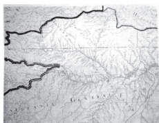
Fig. 4. La capitania de Sao José do Rio Negro, detalle de Luis Albuquerque de Mello Pereira e Cáceres, “Nova Carta da América Meridional,” (Nuevo Mapa de América Meridional), 1789. National Archives (UK), Kew. 45

Aunque derivados de otras fuentes cartográficas, el mapa de Arrowsmith, tal como el de Albuquerque y el impreso en 1823, hacen pocas referencias a los mapas que se consultaron para su elaboración. Tener en cuenta estos aspectos del proceso de producción cartográfica nos deja entender la manera como el traslado de información de un mapa a otro perpetuaba ciertos tipos de conocimiento y silenciaba otros 42 . Por ejemplo, Arrowsmith, en su mapa de Suramérica, representó la cuenca amazónica, y especialmente los límites entre los imperios ibéricos, con base en el mapa dibujado por Albuquerque, aunque no acreditó directamente a este cartógrafo portugués. Albuquerque, a su vez, silenció en su mapa todos los esfuerzos hechos anteriormente por cartógrafos europeos para indicar la localización de grupos indígenas. Como lo señala Safier, esta información se pasó a otros tipos de representaciones gráficas y literarias 43 . A diferencia de Luis de Albuquerque, Arrowsmith sí indicó la ubicación de grupos indígenas, especialmente en la cuenca amazónica. Es más, el mapa de Arrowsmith apareció junto a una traducción inglesa del Diccionario histórico-geográfico de Antonio de Alcedo y Bejarano. El diccionario junto con el mapa ofrecen un detalladísimo catálogo de los innumerables grupos de naciones indígenas soberanas en la América Española así como también de la localización de minas de oro y plata 44 . (Figs. 4&5)