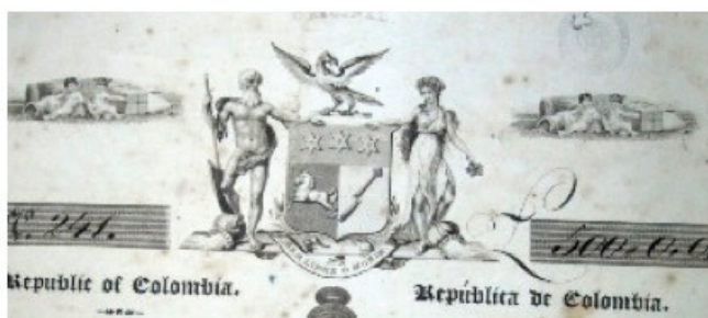
Fig. 8. Detalle de papel notarial fechado 1819, localizado en AGN, Colecciones, EOR, Caja 123, Carpeta 11.

Una república civilizada cuyas regiones estaban unidas por la encantadora fuerza de la naturaleza podría haber sido la imagen que los expatriados hispanoamericanos querían proyectar sobre Colombia, sin embargo, no les fue posible llevar a cabo de manera estable este imaginario. Si comparamos la imagen del cartucho con los papeles notariales que circulaban en Londres como bonos impresos emitidos a cambio de préstamos, podemos encontrar diferencias sorprendentes 52 .