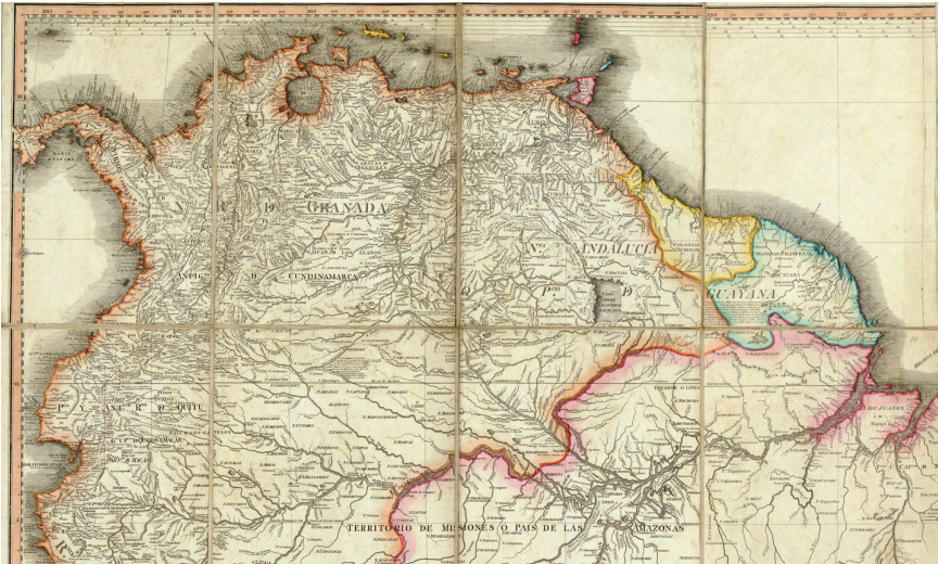
Fig. 2. Juan de la Cruz Cano y Olmedilla, d. 1790; y William Faden, “Mapa Geográfico de América Meridional,” en Mapa Geográfico de América Meridional...año de 1775... Londres, W. Faden, Enero 1 de 1799. Localizado en David Rumsey Historical Map Collection.

El mapa de 1823 tenía un propósito claro: persuadir al “Lector General, al Comerciante y al Colono” que le servía a los intereses de Gran Bretaña el reconocer la independencia de Colombia. El título del mapa, “Colombia, tomada de Humboldt y varias otras autoridades recientes”, buscaba legitimar la imagen cartográfica -y la construcción geográfica de Colombia en sí-- al anunciar su pedigrí científico. Pero, la atribución es engañosa. Este mapa se basaba sobre el trabajo de un experto diferente, Aaron Arrowsmith (1750-1823). Para entender lo que significó usar el mapa de Arrowsmith es necesario conocer primero que otros mapas de Sudamérica pudieron haber usado los que participaron en la producción del mapa de 1823. Uno de ellos, el de más circulación entonces, era el de William Faden (1750-1836), geógrafo del rey desde 1771.