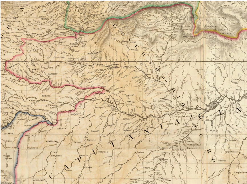
Fig. 5. Governo do Rio Negro, detalle de A. Arrowsmith, “South America, 2,” 1790.

mapa de 1823 también adopta la frontera luso-hispanica que Arrowsmith copió de Albuquerque. Reconocer esta frontera para Colombia significaba adoptar los intereses diplomáticos de los británicos, y por extensión, ciertos aspectos de las visiones portuguesas acerca del territorio suramericano, sus recursos, y el control político. Tal vez este fue el precio que los expatriados hispanoamericanos y sus aliados en Gran Bretaña estaban dispuestos a pagar por el reconocimiento de Colombia, ya que el desafiar los reclamos territoriales brasileiros significaba retar también los intereses económicos de los británicos 46 . Es en este sentido que los contornos seleccionados para el mapa de 1823 ilustran dramáticamente el efecto que puede tener el lugar de impresión en la construcción cartográfica. En cierta forma, se podría considerar que este mapa, que pretende ser “pos-imperial,” asumió visiones de otros imperios para distanciarse del imperio que todavía ejercía una presencia militar y política importante en su territorio: España.