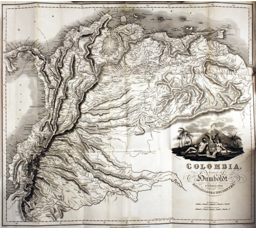
Fig. 1. "Colombia tomado de Humboldt y otras autoridades recientes," en A. Walker (ed.), Colombia... El mapa se encontró en la copia del libro de la Biblioteca Luis Ángel Arango (BLAA) Libros Raros y Manuscritos (LRM), 918.6 Z31c7.

el mapa que ilustra los dos volúmenes demuestra los límites que Gran Bretaña buscaba imponer sobre cómo se debería ver Colombia. Por lo tanto, la imagen que se produjo en Londres se basó en una tradición cartográfica británica que, a partir del 1808, año en el que la armada británica escoltó a la corte portuguesa a Brasil, favorecía los intereses portugueses a costa de la corona española. Como consecuencia, esta circunstancia diplomática desfavorecía a los intereses territoriales colombianos.