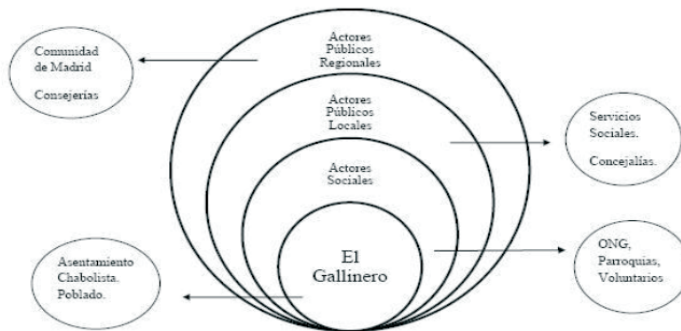
Figura 1: Actores en El Gallinero