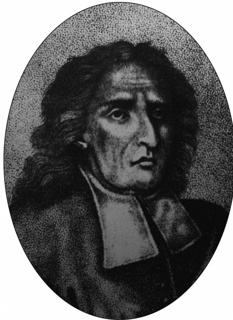
De una litografía de Luigi Rados (1821)

«Nosotros, en cambio, que no pertenecemos a ninguna secta, hemos de indagar» (De Antiquisima , Proemio)