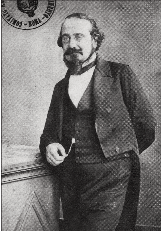
Bertrando Spaventa (1817-1883). Foto anterior a 1883.