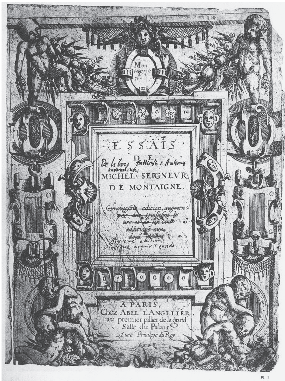
Ilustración 1: Frontispicio grotesco de la edición de 1588.