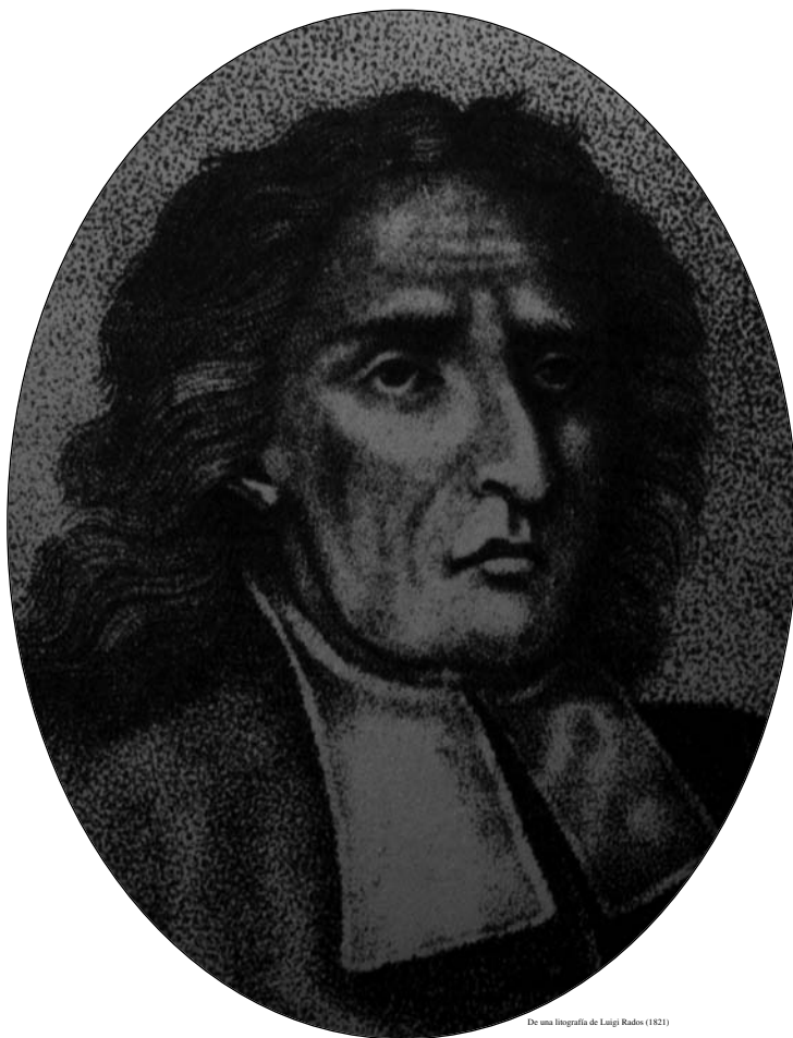
De una litografía de Janji Rados (1821)

“nosotros, en cambio, que no pertenecemos a ninguna secta, hemos de indagar” (De Antiquissima , Proemio)