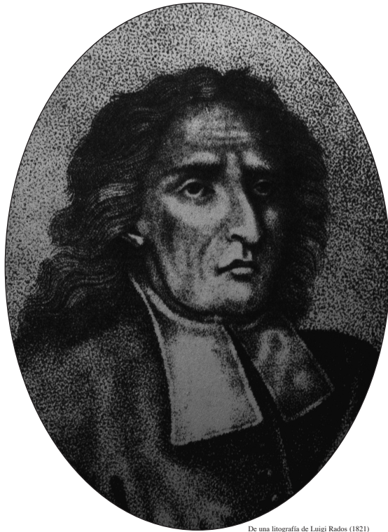
De una litografía de Luigi Rados (1821)

“nosotros, en cambio, que no pertenecemos a ninguna secta, hemos de indagar” (De Antiquissima , Proemio)