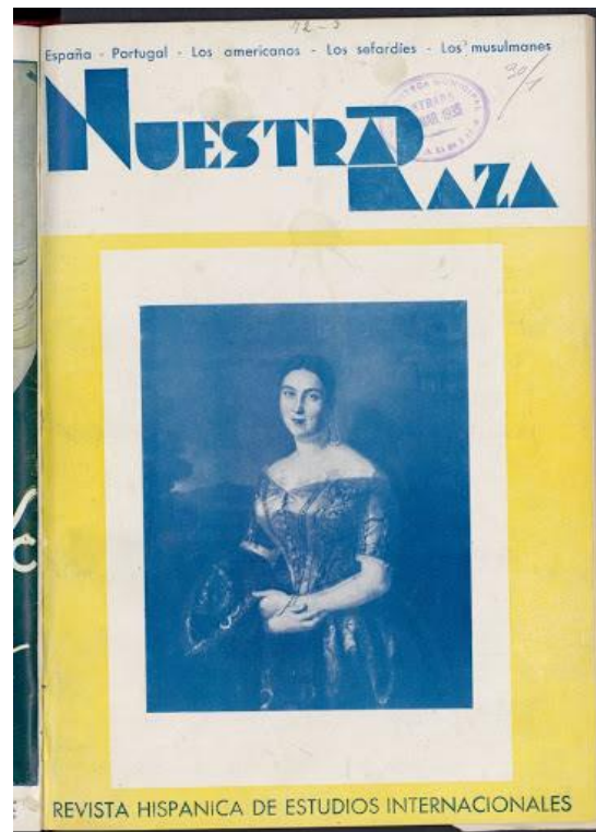
IMAGEN 2. Ejemplar de la revista Nuestra Raza.