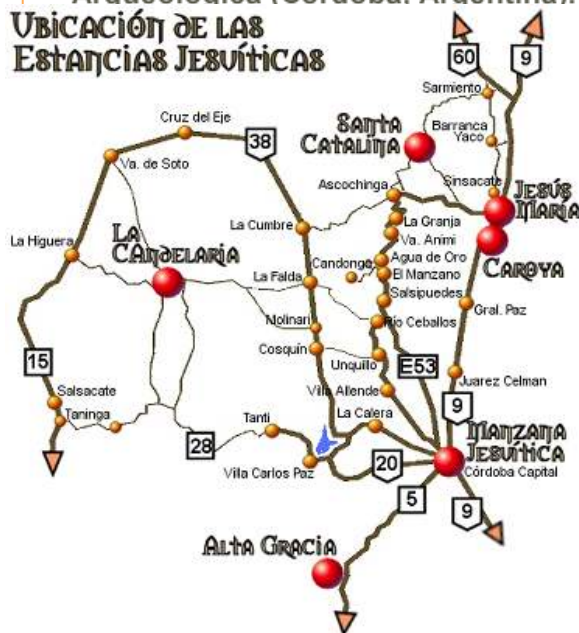
Fig. 12. Plano de la región con las estancias jesuíticas declaradas como Patrimonio de la Humanidad