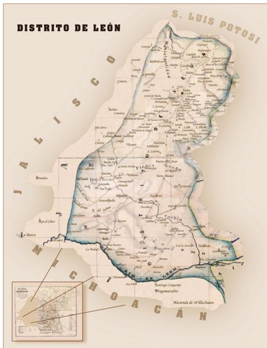
Mapa 2. Distrito de León

José Guadalupe Romero, Noticias para formar la historia y estadística del obispado de Michoacán , 1860, Guanajuato, Gobierno del Estado de Guanajuato, 1992.