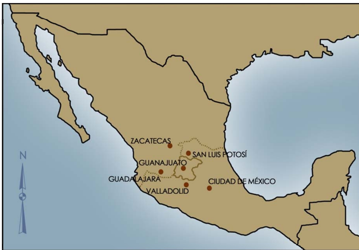
Mapa 1. Límites entre las Audiencias de México y Guadalajara, siglo XVI