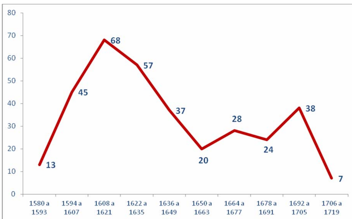
Gráfica 1. Contratos de compraventa celebrados en la alcaldía mayor de León entre 1581 y 1811