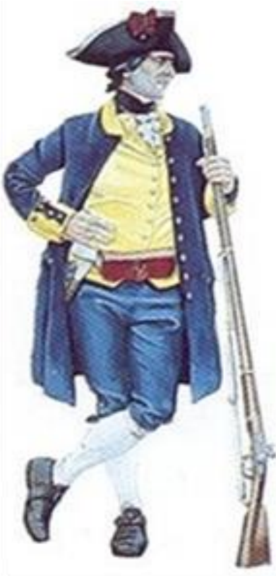
Oficial de la compañía franca de voluntarios de

Cataluña