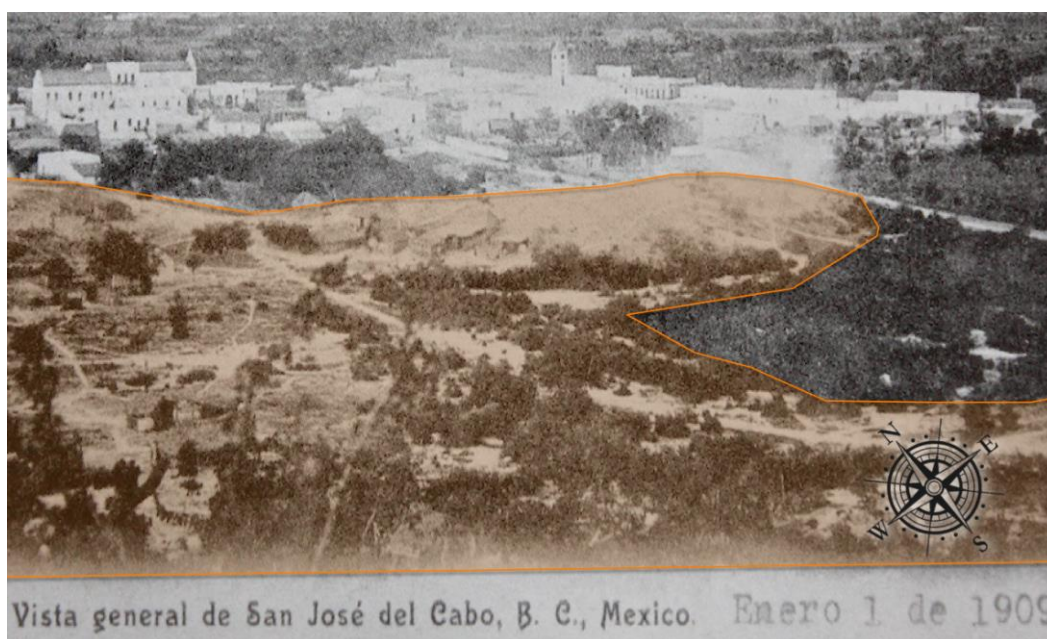
Figura 3. Panorámica de San José del Cabo en 1909

Así, dos pulsos de flujos de grandes proporciones invadieron el entorno y causaron destrucción y muerte en San José del Cabo. 28 Para el historiador Pablo L. Martínez la crecida fue como una “avalancha de agua” y una “ola desprendida de la sierra”. 29 Durante la inundación murieron 26 personas, el número de pérdidas animales fue impreciso, pero según la prensa escrita, a la orilla del mar y a lo largo de la cañada, se veían innumerables animales ahogados, caballos, mulas, vacas, cerdos, cabras y gallinas. Así transcurrió la etapa de crisis y emergencia por la inundación.