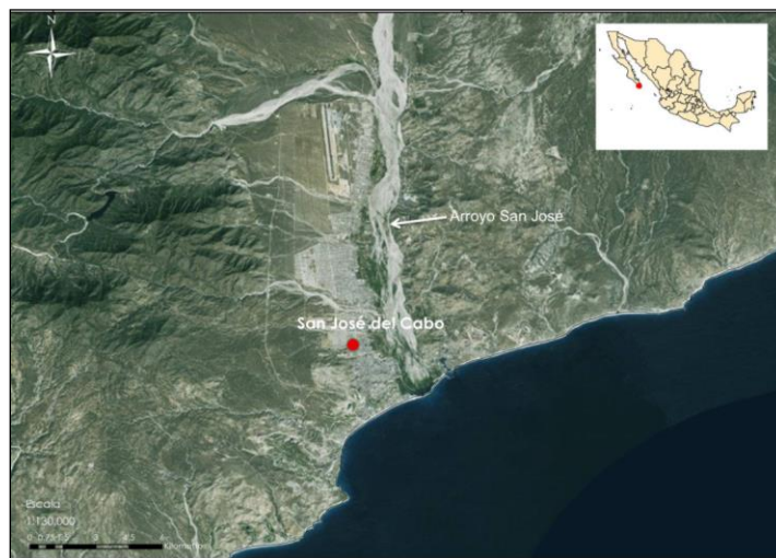
Figura 1.- Ubicación de San José del Cabo en la Península de Baja California Sur, México.

Baja California Sur es un estado de la república mexicana, característico por su medio ambiente desértico debido a la intensidad de los rayos de sol y a la escasez de lluvias. En el paisaje son notables distintas especies de cactus que surgen entre la arena seca. Al centro de la península se hace evidente la elevada serranía que inicia al sur y se extiende en casi toda la península hacia el norte. En la península de Baja California Sur se ubica un área particularmente expuesta al impacto de los huracanes, en las coordenadas 22°53'23.15" N y 109°55'07.49" O, a 50 kilómetros al sur de la línea del Trópico de Cáncer, que abarca el área de San José del Cabo, municipio de Los Cabos.