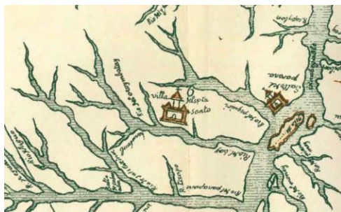
Fig. 2 Detalle del mapa atribuido a Ruy Díaz de Guzmán (c.1607), donde se representa a las ciudades de Villa Rica (villa del Sptu Santo) sobre el Ivaí y Ciudad Real del Guayrá sobre el Piquirí (Salto del Parana). (Daniel García Acevedo, “Contribución al estudio de la cartografía de los países del Río de la Plata”. Anales de la Universidad, n° XII, (Montevideo, 1905), p. 269).

Y en 1607 Díaz de Guzmán la ubica en un mapa a él atribuido (Fig. 2)