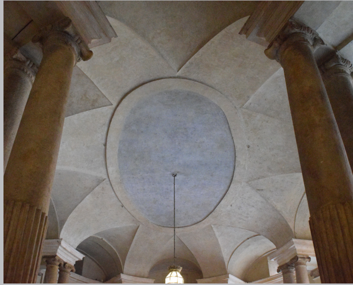
Figura 2. Bóveda estelar en el palacio Carignano, Turín, 1679-85, Guarino Guarini

uno a uno. Así pues, este trabajo muestra sistemáticamente y de modo muy didáctico el desarrollo de una amplia investigación que ha exigido de sus autores labores de alzamiento y posterior modelado de las obras más relevantes acompañadas del vaciado de los documentos de archivo y de la bibliografía histórico-crítica en la que se insertan estas piezas de la arquitectura civil y urbana barroca que, en esta capital y en este periodo, alcanzaron cotas técnicas y estéticas de relieve donde las formas revelan el complejo proceso de la construcción material de estos vestíbulos abiertos y cerrados a un mismo tiempo. Todos los conocimientos recopilados se refieren a la cartografía actualizada y los dibujos realizados por los autores para la ocasión, donde los zaguanes (antecedentes de los portales de los inmuebles residenciales burgueses erigidos durante todo el siglo XIX), de holgadas dimensiones, se sustentan sobre una base histórica que es puesta al día por levantamientos minuciosos en planta y sección, con el sustrato de una geometría regular, completados por la axonometría de cada uno de ellos donde se detallan todos los fragmentos de bóvedas y cúpulas que están en el origen de los experimentos de macla de volúmenes en los que los arquitectos demuestran su destreza y profesionalidad, tanto en las artes del diseño, como en el igualmente difícil arte de la construcción.