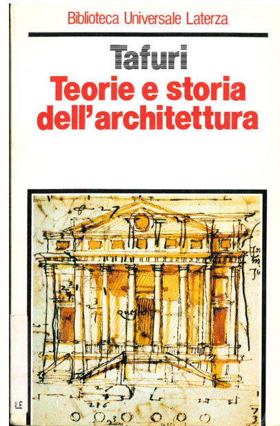
Figura 2. Copertina di TAFURI, Manfredo. Teorie e storia dell'architettura . Roma-Bari: Editori Laterza, 1986.

dopo» 36 la pubblicazione del libro, Purini ha infatti affermato che la prima immagine di copertina era stata il frutto di un equivoco col grafico della casa editrice, il quale, parlando al telefono con l'autore, aveva confuso un'incisione di Piranesi con il progetto dei giovani architetti romani.