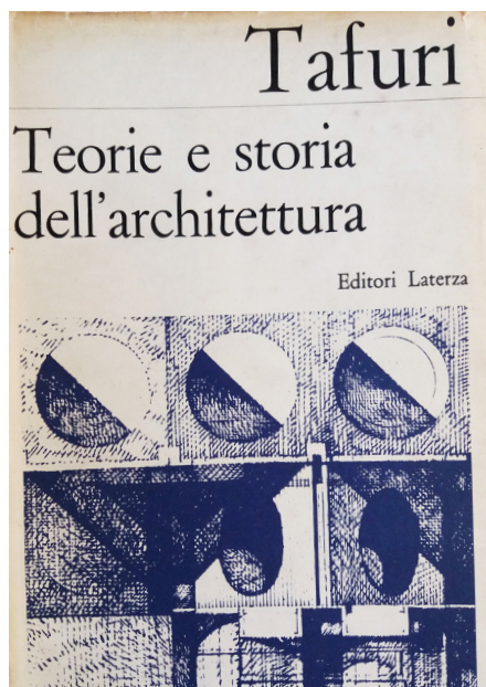
Figura 1. Copertina di TAFURI, Manfredo. Teorie e storia dell'architettura . Bari: Editori Laterza, 1968.