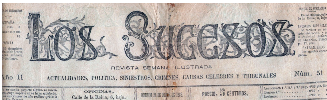
Cabecera de la revista semanal Los Sucesos nº 51 (21-X-1883). Imagen 1.

eslogan de su cabecera por el de "Revista semanal ilustrada. Actualidades, política, siniestros, crímenes, causas célebres y tribunales", añadiendo a sus contenidos temáticos la política y los tribunales.