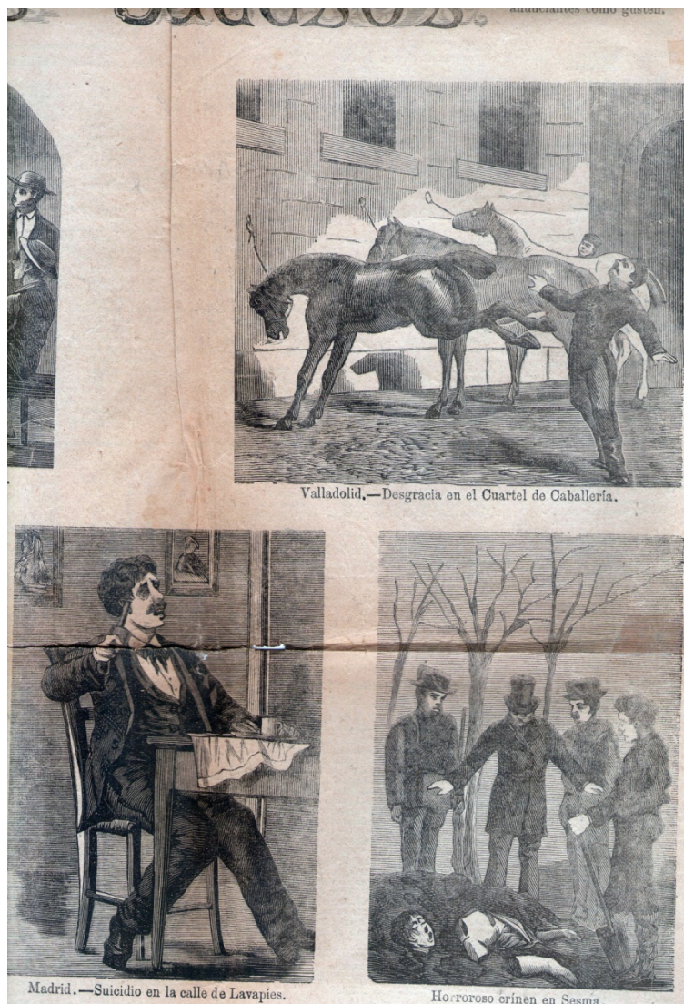
Grabados publicados en Los Sucesos nº.51, p. 3. Imagen 2.

Analizando un ejemplar correspondiente al nº 51 (21 de octubre de 1883), observamos que la primera página está ocupada por once noticias encabezadas por los siguientes titulares: "Don José Posada Herrera", "Don Servando Ruiz Gómez", "Don Aureliano Linares Rivas", "Don José López y Domínguez", "El Marqués de Sardoal", "Sr. Don Segismundo Moret", "Don Alberto Aguilera", "Célebre nadadora", "Valladolid. Desgracia en el Cuartel de Caballería", "Madrid. Escándalo en La Taurina, calle del Lobo" y "Horroroso crimen en Sesma". Siete informaciones hacen referencia a políticos de la época, ministros y gobernadores civiles.