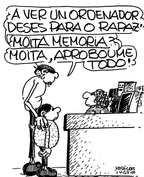
Figura 4: Xosé Lois, O Carrabouxo, La Región , 2009

Xesús Campos Álvarez, más conocido como Chichi Campos, nació en la Laguna (Tenerife) en 1952 y falleció en Santiago de Compostela en 1991. Fue uno de los más inteligentes y prolíficos humoristas gallegos, lleno de ingenio e ironía, pero su prematura muerte, el 26 de febrero de 1991, cuando apenas tenía 38 años, privó a Galicia de lo mejor de su carrera. Cofundó a principios de los 70, con Xosé Díaz Arias y Luís Caparrós Esperante, el grupo de cómic del Castro, que publicaría desde Suiza un único número de la revista A Cova das Choias (1974). Su obra es un testimonio humorístico, subversivo e irreverente de la Transición, con especial predilección por los estamentos político, económico, religioso y militar de la época. Colaboró en numerosas publicaciones gallegas y foráneas ( A Voz do Pobo , Mundo Obrero , A Nosa Terra , La Voz de Galicia , El Ideal Gallego , El Progreso , La Región ), además de ser guionista de la recién nacida TVG.