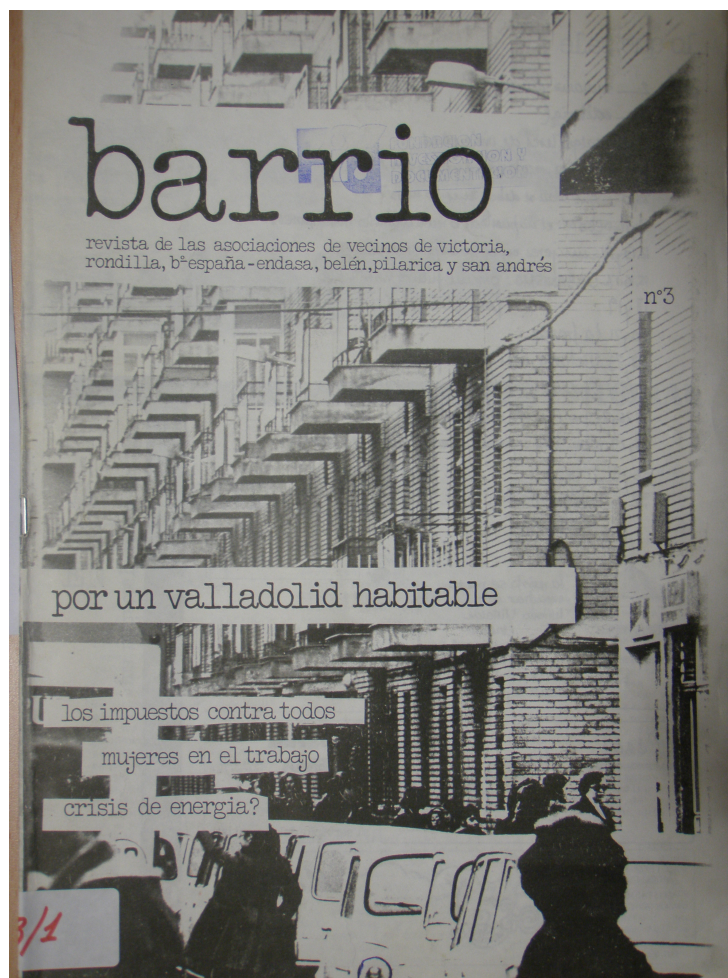
1. Portada del número 3 de Barrio , del año 1981, con una fotografía de Las Delicias.

Muchas asociaciones publican sus boletines, con una periodicidad mayor o menor. Podríamos destacar el boletín de «La Unión» de Pajarillos, que tiene el significativo nombre de El Búho , jugando con los nombres de ave de las calles de la barriada pero también por ser éste un animal tradicionalmente asociado a la vigilancia.