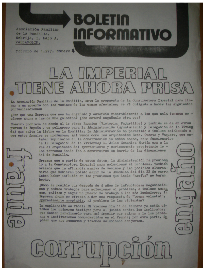
3. Boletín de la Asociación Vecinal Rondilla en septiembre de 1977, en torno al serio problema estructural de las casas levantadas por la Constructora Imperial SL en el barrio.

Si difícil es saber las tiradas de ejemplares, puesto que no hay documentación al respecto, es casi imposible conocer su impacto entre los vecinos, público a quien iban dirigidas estas publicaciones informales. Pero si aceptamos que cada asociación publicaba con cierta periodicidad un boletín, informando de los problemas puntuales del barrio y de las medidas que proponían a los vecinos para solucionarlos y que cada tirada estaría compuesta por varios cientos, cuando no miles de ellos, parece plausible pensar que el barrio estaría perfectamente informado gracias a estas publicaciones.