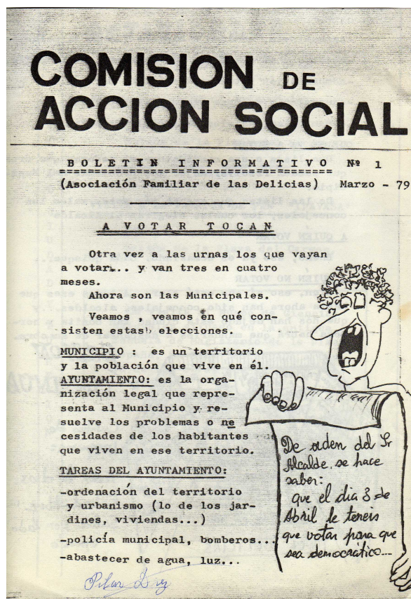
2. Separata de la revista de la Asociación Familiar Delicias, Boletín Informativo , especial dedicado a los miembros de la tercera edad del barrio y la pedagogía democrática. Marzo de 1979.

Es prácticamente imposible saber la difusión de estos boletines, muchos de ellos hojas volanderas más que revistas. Sólo tenemos la referencia para el año 1977, en que Hoja del Lunes se hace eco de la asamblea realizada por la asociación de Rondilla, donde haciendo recuento de las actividades llevadas a cabo, se habla del reparto de “6000 boletines informativos la semana pasada” 22 .