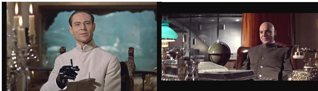
Figura n. 5 Fotograma Agente 007 contra el Dr. No . Figura n. 6 Fotograma Al servicio secreto de...