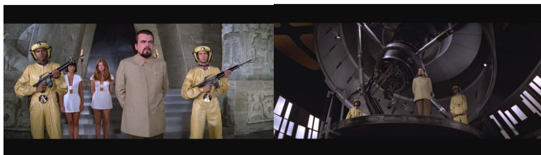
Figura n. 9 Fotogramas Moonraker

Enumeramos a continuación aquellos títulos en los que no se hace mención expresa a Spectra: Diamantes para la eternidad , Vive y deja morir y El hombre de la pistola de oro . Son tres películas consecutivas: 1971, 1973 y 1974. En los dos primeros títulos, de hecho, no está definida de forma nítida la pugna Este-Oeste. En otro sentido, la