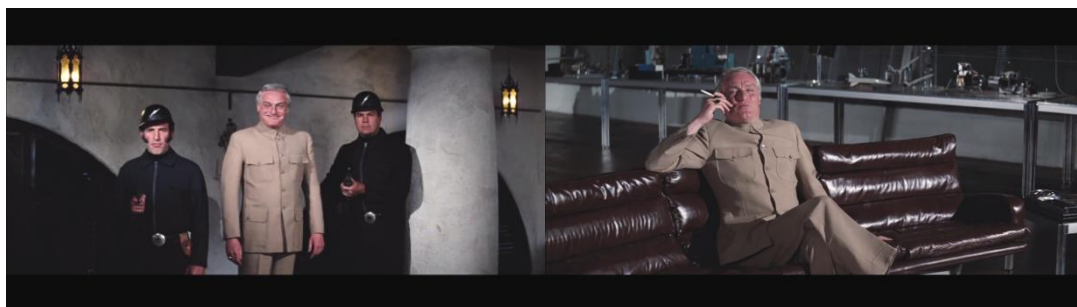
Figura n. 8 Fotogramas Diamantes para la eternidad