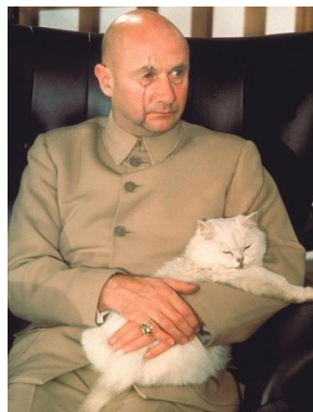
Figura n. 7 Fotograma Sólo se vive dos veces