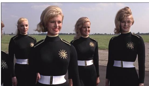
Figura n. 3 Fotograma Goldfinger

Kamal Khan, una especie de príncipe afgano en el exilio, es el protagonista de Octopussy , y es “un estafador que vende mercancías de dudosa procedencia”. Una de sus socias es Octopussy a quien Bond pregunta: “¿Cómo tiene tantas preciosidades?”, refiriéndose a sus empleadas. “Les ofrezco una manera de ganarse la vida”, contesta. “¿En la delincuencia?”, pregunta Bond. “En los negocios”, contesta Octopussy. El número de mujeres que de ordinario han formado parte del Ejército rojo no puede cuestionarse, de ahí podríamos concluir que su presencia en la saga adopte una posible doble interpretación: la incorporación de mujeres en el terreno bélico del bloque soviético, y la utilización de las féminas como objetos necesarios para la narración. Además del título mencionado, otras películas en las que aparecen mujeres como soldados de Spectra son Goldfinger y Moonraker .