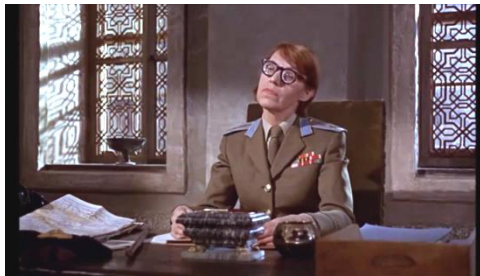
Figura n. 4 Fotograma Nº 3 en Desde Rusia con amor

Los brazos ejecutores de Spectra están, si cabe, más caricaturizados que los líderes a quienes sirven. En Desde Rusia con amor , se trata de un rubio apolíneo soviético “convicto de asesinato, escapado de prisión y reclutado en Tánger”. “Es de los mejores que hemos tenido, homicida paranoico, buena materia prima”, señalan en Spectra. En este mismo título, Nº 3, la agente Rosa Klebb, engrosa también la lista de colaboradores de Spectra deformados por la saga. En igual sentido advertimos a Irma Bunt, responsable de la muerte de la única esposa de Bond, y quien señala en Al servicio secreto de su Majestad : “es tan bonito matar a unos y a otros”.