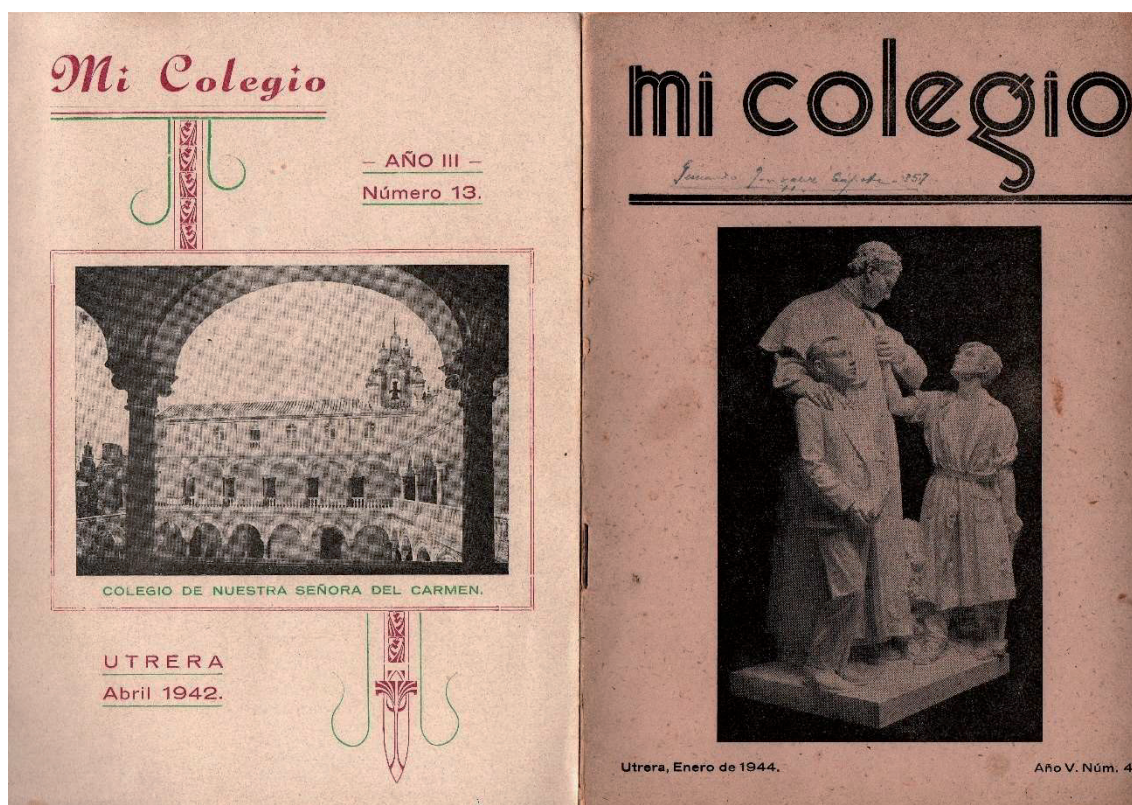
Figura 1. Evolución de las portadas de Mi Colegio . Año III, nº 13, abril 1942 y año V, nº4, enero 1944.