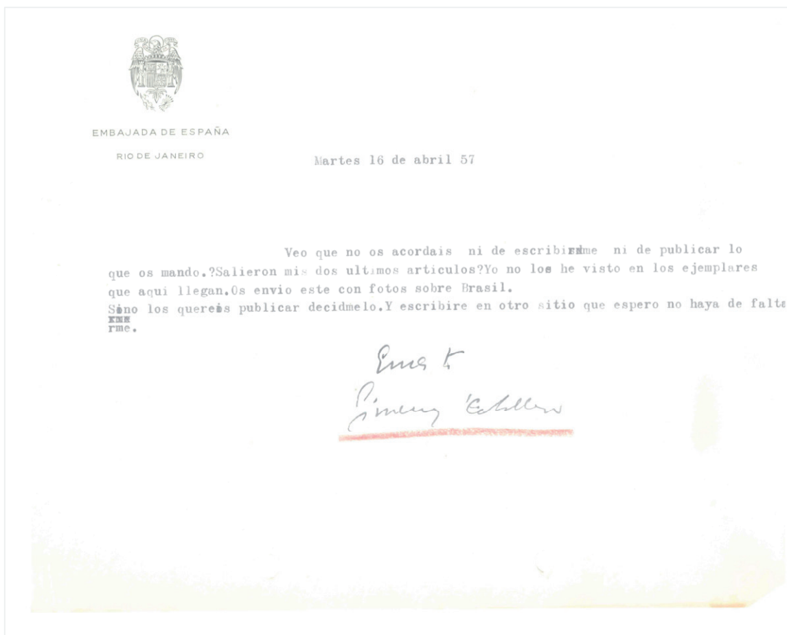
Fig. 4. ARCM. Fondo Prensa del Movimiento Sign. 13044/93. Carta de Ernesto Giménez Caballero al director del diario "Arriba" quejándose de la falta de publicación de sus artículos.

También aparecen como emisores de las misivas políticos y directores de otros medios de comunicación, personas de instituciones públicas y privadas, o particulares, siendo las más interesantes aquellas mantenidas con colaboradores como Ernesto Giménez Caballero, Miguel Delibes o Gonzalo Torrente Ballester, y con la Dirección General de Prensa por sus datos sobre censura y gestión de la información.