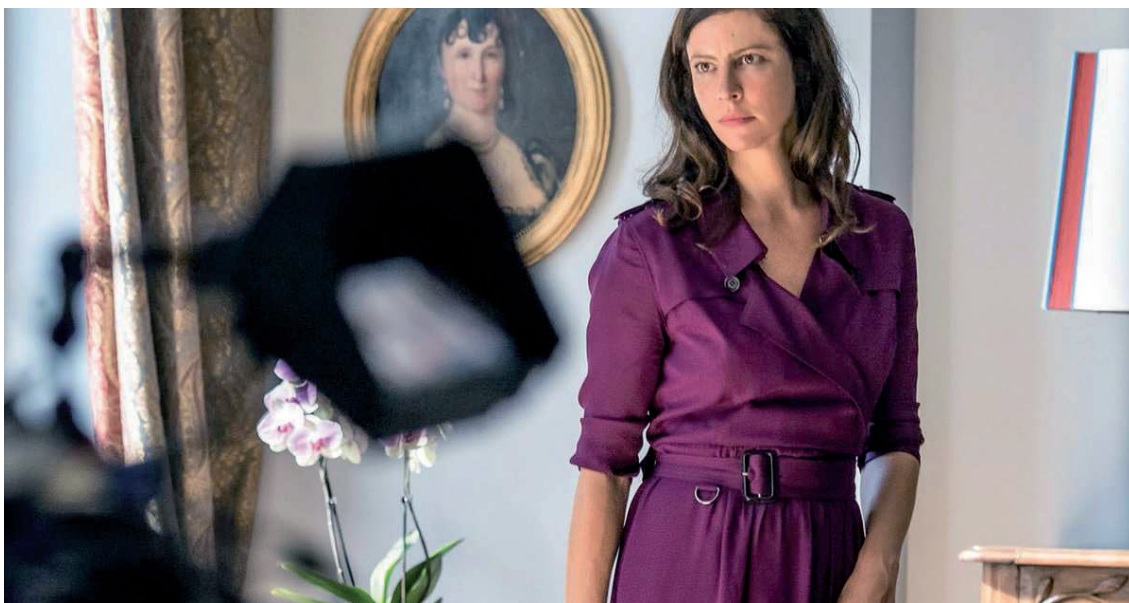
A presidente de França Amélie Dorendeu (Anna Mouglalis)

Amélie Dorendeu, ex-comissária europeia, egressa de uma família burguesa e das melhores universidades francesas, à medida que vai assumindo maior protagonismo político, vai incorporando os cânones da racionalidade nos comportamentos em público. Ao longo da sua carreira, a atração por políticos, homens fortes, faz com que se subalternize nas suas convicções e abandone a sua vida pessoal. Disputada por dois líderes socialistas, no plano político e sexual, acaba por se envolver com o protagonista Philippe Rickwaert, deputado caído em desgraça e spin doctor , homem divorciado e machista. Contudo, Amélie Dorendeu não é o trofeu de beleza e elegância desprotegido que aparenta. Sem nunca ter passado pelo sufrágio universal, ela utiliza a sedução como uma arma de manipulação perigosa, capaz de servir as suas ambições pessoais de poder, primeiro para se tornar o braço direito de um presidente (1ª temporada) e, posteriormente, para ela própria tornar-se presidente de França (2ª temporada). Na 3ª temporada, acossada por movimentos sociais hostis e forças político-partidárias de extrema-direita, põe o cargo à disposição e suicida-se, num ato designado pelos seus pares de “nobreza republicana”.