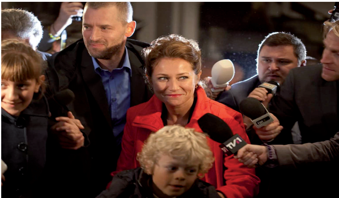
A primeira-ministra dinamarquesa, Birgitte Nyborg, e sua família.