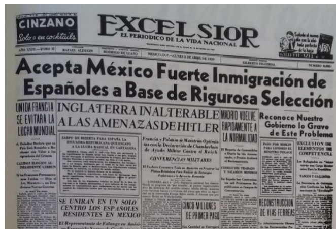
Excélsior 3 de abril de 1939 p. 1