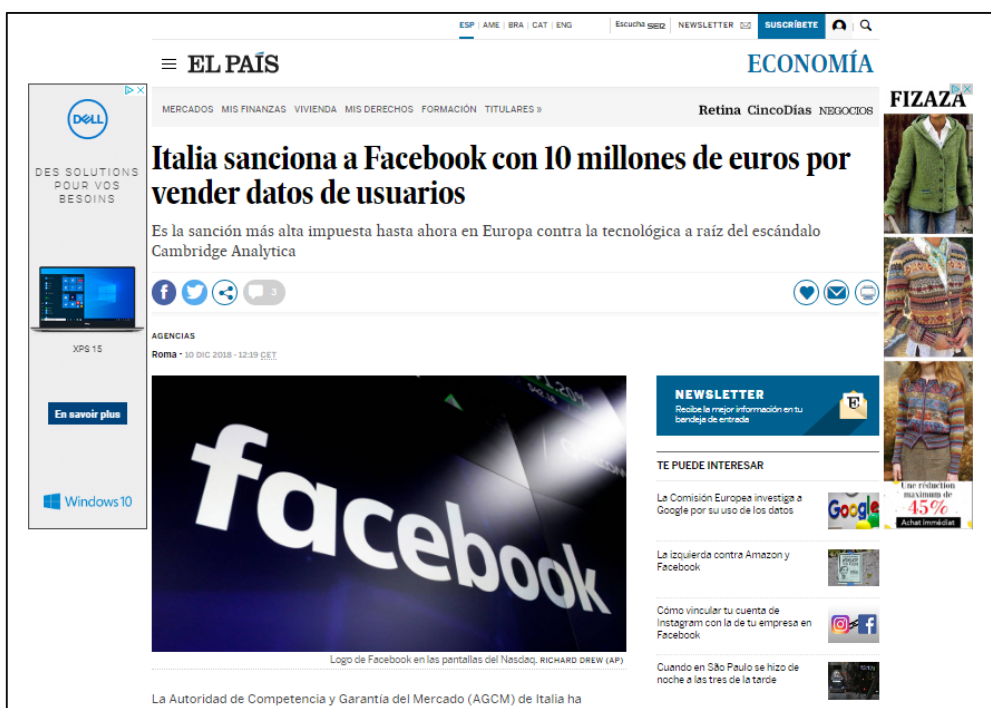
Imagen 2. Noticia de El País, 10 de diciembre de 2018.

campaña electoral de Donald Trump en 2016. Como consecuencia, Facebook afronta una de las mayores crisis hasta el momento en su sistema de negocio publicitario. No sólo son frecuentes las investigaciones y sanciones impuestas por la Comisión Europea desde 2016, sino también se llegan a conocer las acciones emprendidas por cada país tras el suceso Cambridge Analytica . En el mes de octubre, Reino Unido multó a Facebook con la suma de 500.000 libras (565.000 euros) y la Autoridad de Competencia y Garantía del Mercado (ACGM) de Italia impuso en diciembre dos multas de un total de 10 millones de euros viii , lo que supone la más alta sanción europea recibida hasta el momento. La empresa tecnológica de Zuckerberg no queda exenta ante el no respeto al Código del Consumidor mediante la venta de datos de usuarios y, asimismo, precisan que debería resolverse la falta de claridad a la hora de informar al usuario de Facebook en el momento de su registro de que todos los datos que faciliten conllevarán ganancias a nivel comercial aunque se trate de un servicio gratuito en tanto que red social.