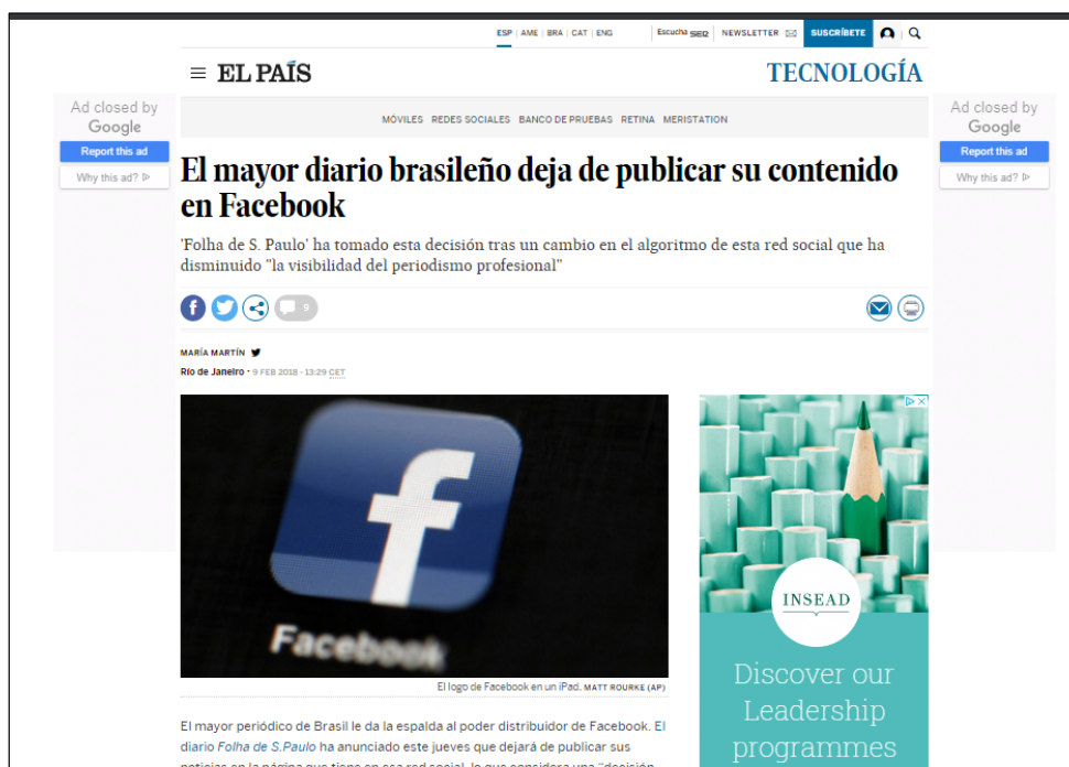
Imagen 1. Noticia de El País, 9 de febrero de 2018.