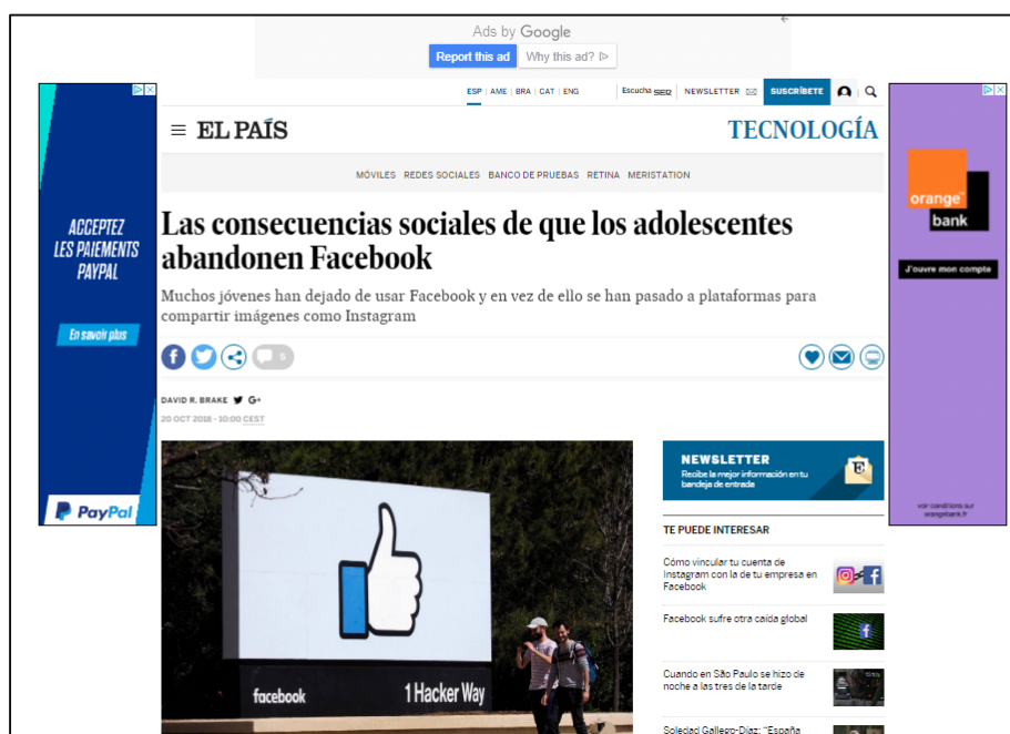
Imagen 3. Noticia de El País, 20 de octubre de 2018.

expresión xiv . Del mismo modo, el diario hace de plataforma para trasladar consejos sobre cómo gestionar la privacidad y cómo realizar un buen uso de la red social al estar conectado. En el Día Internacional de la Protección de Datos Facebook presentó por primera vez sus siete principios de privacidad fundamentales e informó de la incorporación de un servicio de vídeos educativos, disponible en la sección de “ Noticias ” ( News Feed ), en cuanto a la administración de la información y la gestión de datos de los usuarios en la plataforma.