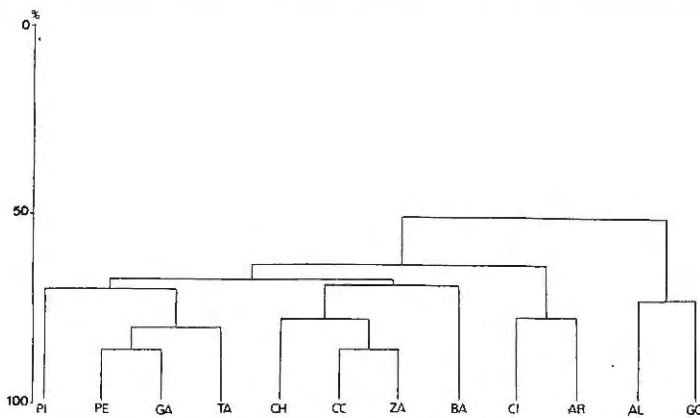
FIGURA II DENDOGRAMA RESULTANTE EN BASE A LA MATRIZ DE IMPACTOS OBTENIDA PARA LAS LAGUNAS ESTUDIADAS SEGÚN ÍNDICE DE SIMILARIDAD DE BRAY-CURTIS

El algoritmo de agrupación utilizado fue el UPGMA (Unweighted pairgroup method using arithmetic average). PI: Pilon; PE: Peña; GA: Galiana; TA: Taraje; CH: Charroao; CC: Calderón Chica; ZA: Zarracatín; BA: Ballestera; CI: Cigarrera; AR: Arjona; AL: Alcaparrosa; GO: Gosque.