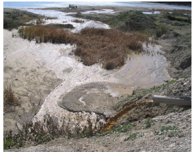
Figura 6: Vertidos líquidos por lavados