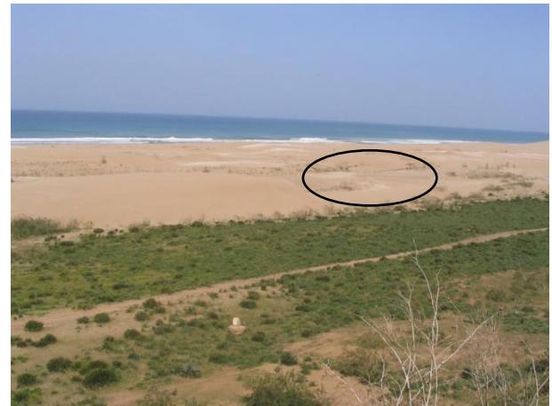
Figura 8: Una explotación que en ocasiones supera la duna y alcanza la playa

A su vez el transporte de los materiales por las máquinas genera una compactación del suelo.