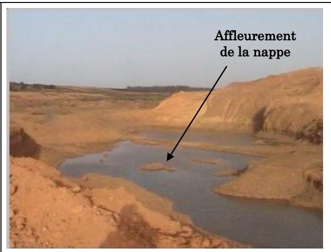
Figura 4: : Cantera Aluvial Ilegal de Lalla Mimouna