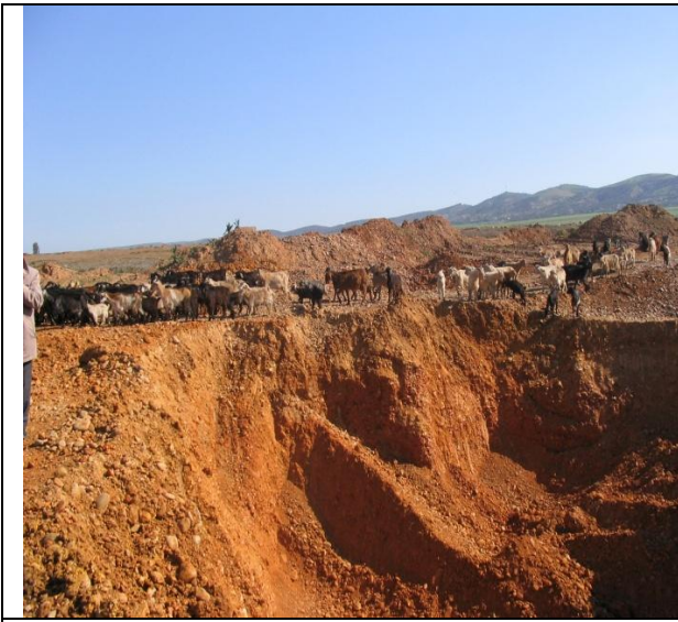
Figura 5: Cantera transformada en Vertedero