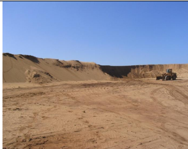
Figura 7: Cambio de la morfología del Cordón Dunar