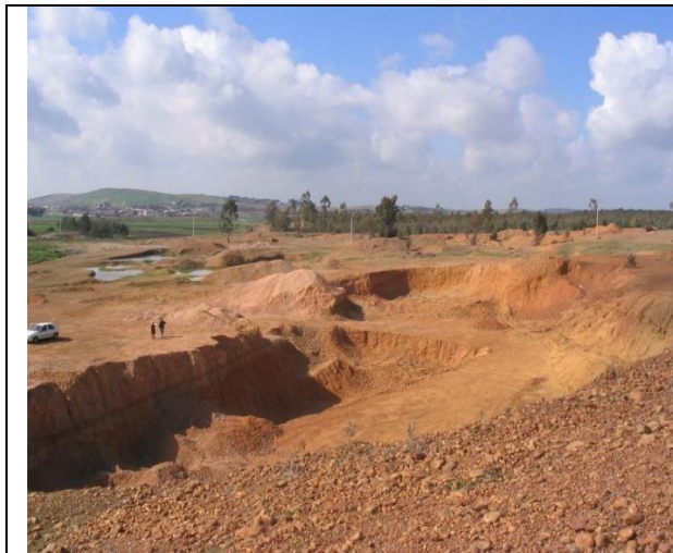
Figura 3: Ejemplo de cantera colindando con un sitio arqueológico (Sitio arqueológico de Al Basra)

Por otro lado, la cantera de arcilla de Lalla Mimouna opera en un campo de uso tradicional agrícola, provocando un gran impacto negativo sobre el valor de mercado de las tierras agrícolas cercanas y sobre la calidad de los productos agrícolas por la liberación de polvos a causa de la actividad extractiva.