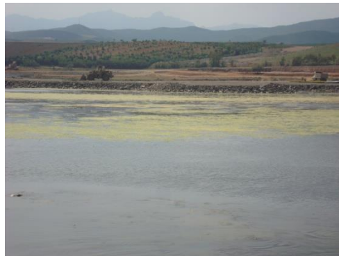
Figure 15: Photo de la zone humide (lagune Smir) Avant l'installation du chantier.