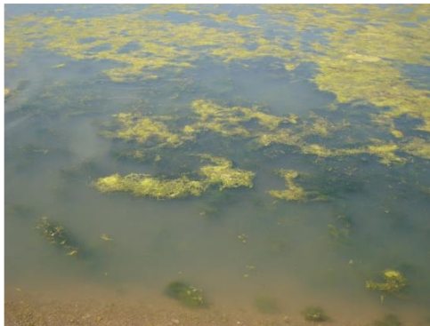
Figure 18: Photo du site de la lagune smir durant les travaux.

Les travaux de terrassement, de remblaiement ou de nivellements liés à l'aménagement du chantier génèrent des travaux de défrichage et de décapage des sols dont l'impact sur le sol reste très important (figure 18). En effet, ils peuvent être facteur d'érosion en particulier en zone sensible (pente, ancienne structure tectonique...). Il faut également préciser que la présence de nombreux engins risque de créer des compactages, des tassements et piétinements localisés au niveau du sol, sur le parcours empruntés par les engins.