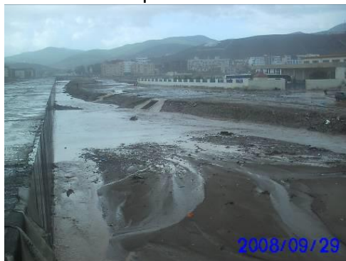
Figure 19: Photo d'oued kandissa Après les inondations du 29-09-2008.

Durant toutes les phases de travaux, les exutoires d'eaux usées ont des impacts négatifs sur l'environnement (figure 19). Ces eaux usées viennent essentiellement des bétonnières et des eaux de nettoyage des engins charriant de la matière en suspension. Pour certains cas, les projets dérogés peuvent ne pas être raccordés aux réseaux d'assainissement. Il est clair que lorsque les eaux ne sont pas traitées convenablement, elles constituent un danger pour l'environnement.