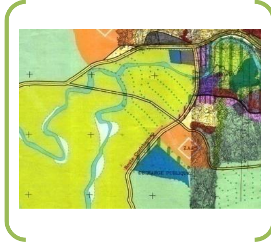
Fig 1: Situation de la décharge publique sur le SDAU 7 de Tétouan Ec: 1/25000.

Le plan d'aménagement fixe également les limites des espaces verts publics (boisements, parcs, jardins figure), des terrains de jeux et des espaces libres. A travers cet article, sont pris en compte les quartiers, monuments, sites historiques ou archéologiques, sites et zones naturelles telles que les zones vertes publiques ou privées à protéger ou à mettre en valeur pour des motifs d'ordre esthétique, historique, culturel, et éventuellement les règles qui leur sont applicables. Ci- dessous, nous reproduisons un extrait du plan d'aménagement de Tétouan al Azhar 8 (figure 2).