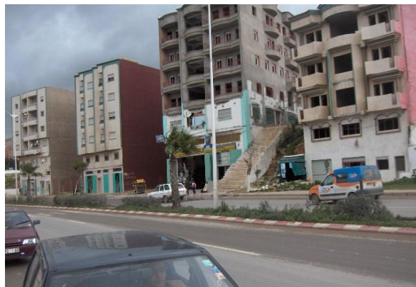
Figure 4. Bâtiments qui respectent les règles de prospec.