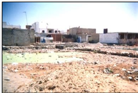
Figure 11. Photo d'une voie au quartier diza à martil non équipée.