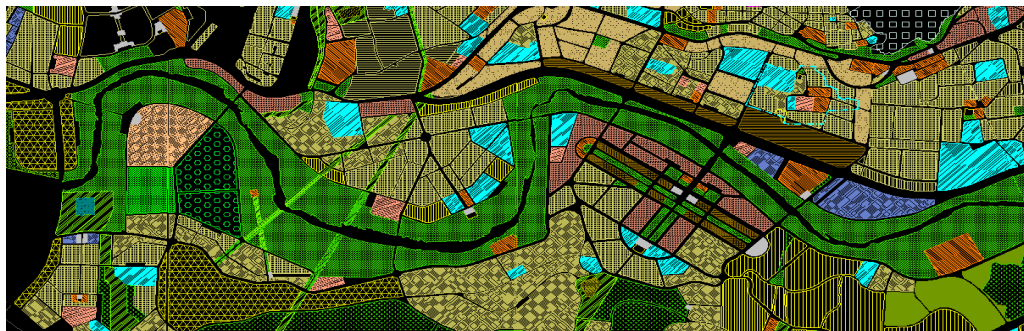
Fig. 2: Extrait du Plan d'aménagement de Tétouan al Azhar homologué 1/25000 oued Martil.

Le plan d'aménagement fixe également les limites des espaces verts publics (boisements, parcs, jardins figure), des terrains de jeux et des espaces libres. A travers cet article, sont pris en compte les quartiers, monuments, sites historiques ou archéologiques, sites et zones naturelles telles que les zones vertes publiques ou privées à protéger ou à mettre en valeur pour des motifs d'ordre esthétique, historique, culturel, et éventuellement les règles qui leur sont applicables. Ci- dessous, nous reproduisons un extrait du plan d'aménagement de Tétouan al Azhar 8 (figure 2).