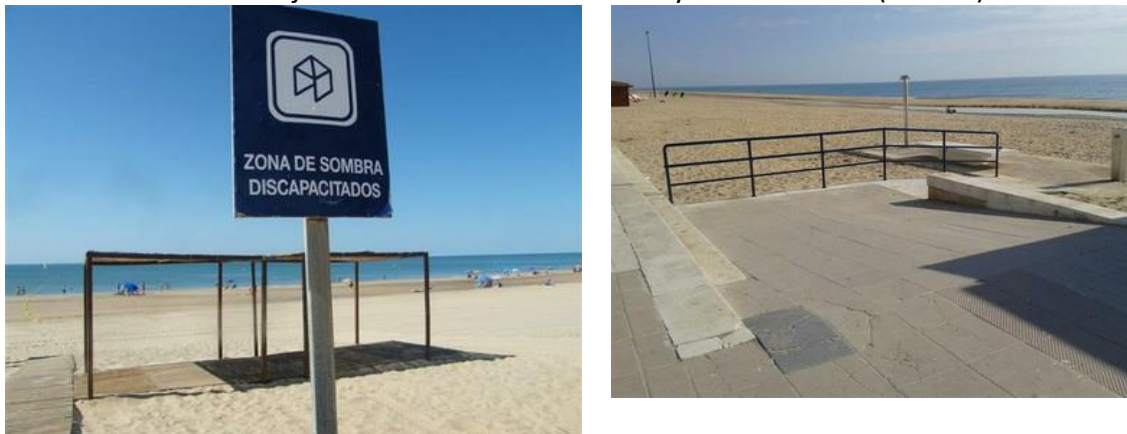
Foto 1. Mejora de la accesibilidad en Playa de La Antilla (Huelva).