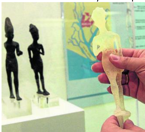
Foto 5. Proyecto Arqueotáctil del Museo provincial de Huelva

El Museo Provincial de Huelva ha realizado recientemente un trabajo para acercar los contenidos de su Sala de Arqueología a las personas con discapacidad visual a través del proyecto Arqueotáctil. El objetivo del mismo es permitir el conocimiento, mediante el tacto, de algunas de las piezas más interesantes que se exponen en este museo.