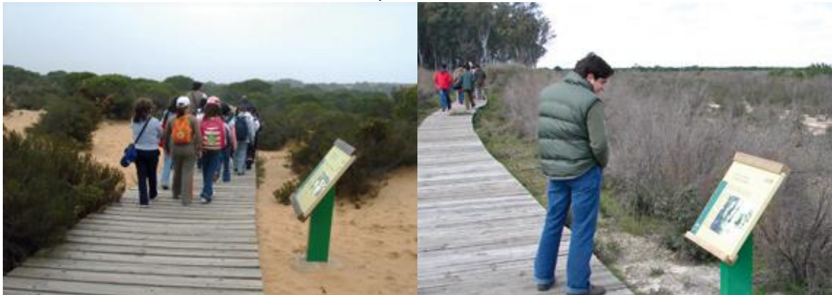
Foto 2. Accesibilidad en espacios naturales de Andalucía

Fuente: Consejería de Agricultura, Pesca y Medio Ambiente (2008). Guía de recursos didácticos de la provincia de Huelva . Junta de Andalucía; ver en: http://www.juntadeandalucia.es/medioambiente/servtc5/ventana/publicacionesCategoria.do;jseccionid=E8745C76EFB611EBEF827C6B47A725D0?tipo=PR&sel=HUELVA