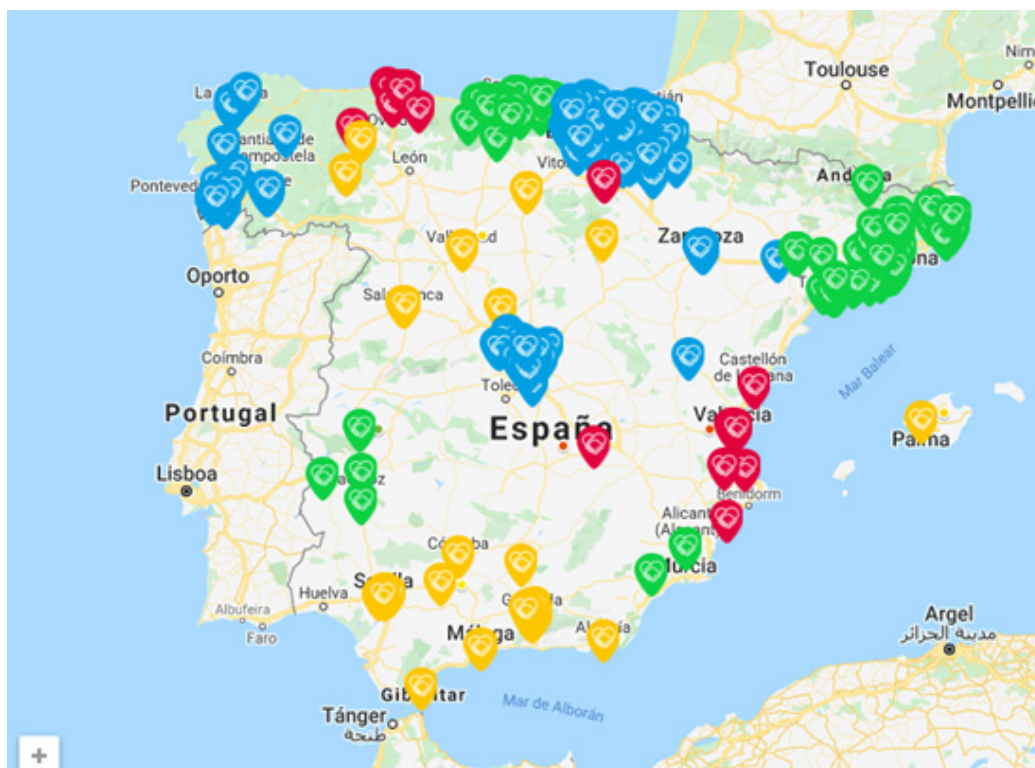
Imagen 4: Mapa de las redes de apoyo mutuo y solidaridad que se formaron en España durante los primeros meses tras el primer estado de alarma.

Otro ejemplo es el Sindicato Popular de Vendedores Ambulantes, compuesto principalmente por personas afrodescendientes, que crearon un banco de alimentos para autoabastecer a por lo menos 300 de sus integrantes. Asimismo, transformaron su tienda en un taller de costura para producir mascarillas y batas sanitarias para ayudar a cubrir el desabastecimiento que sufrieron farmacias, centros de salud y hospitales 16 . Además de estas experiencias, en todo el territorio de España se crearon cientos de grupos y colectivos para enfrentar la pandemia al margen de las acciones que estaba realizando el Estado. En un esfuerzo por darse a conocer, todas estas agrupaciones crearon un mapa en el que se localizan casi 500 iniciativas sociales que se desplegaron por toda España: