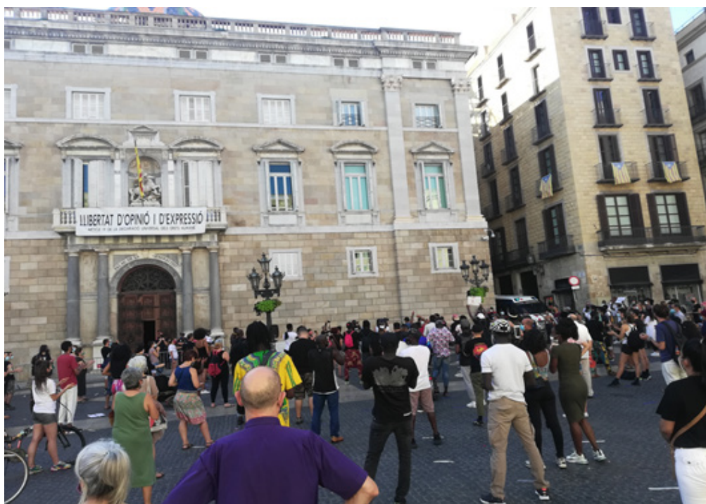
Imagen 3: Concentración política de inmigrantes por la regularización de las personas sin papeles, Plaza Sant Jaume, 19 de julio de 2020.

El espacio urbano de las ciudades fue utilizado nuevamente como sitio de las reivindicaciones. En distintas urbes de España los inmigrantes salieron a exigir la aprobación de esta iniciativa. En Barcelona, diferentes colectivos y organizaciones, como el Sindicato Popular de Vendedores Ambulantes y la propia Red de Cuidados Antirracista, convocaron a una concentración en la Plaza Sant Jaume el día 19 de julio, a la cual acudieron alrededor de cien personas.