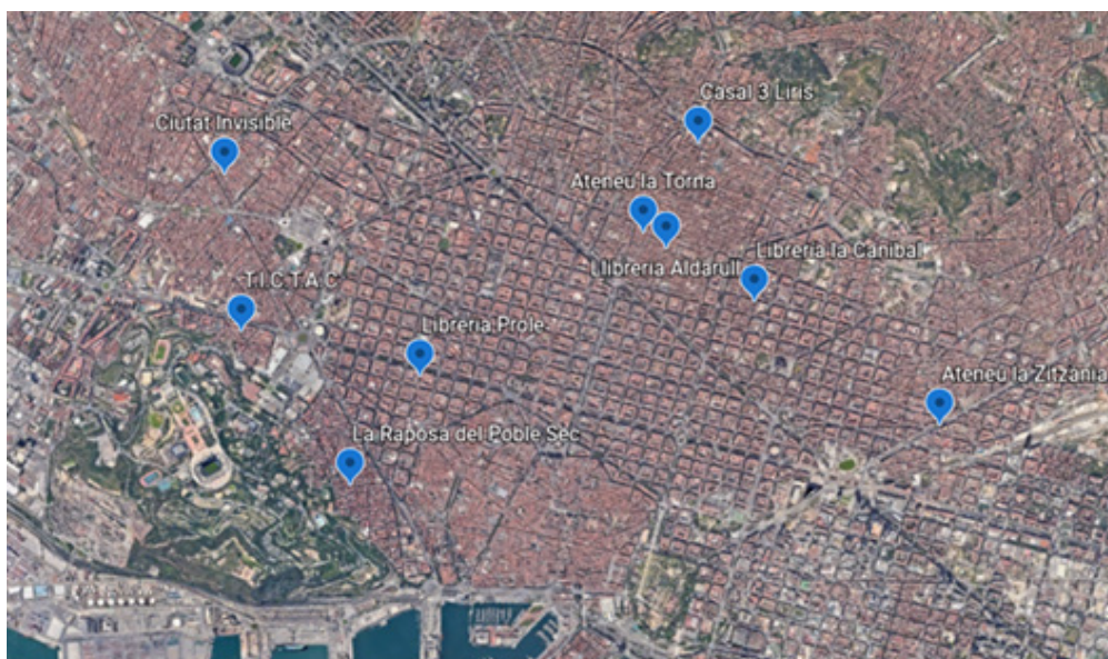
Imagen 2: Centros de acopio de la Red de Cuidados Antirracista de Barcelona.

Los primeros espacios de la ciudad en los que se estaban llevando a cabo la recolección de alimentos y otras ayudas eran Casal 3 Liris (en Gracia) y la Librería Prole (en Sant Antoni). Estos dos espacios funcionaron durante gran parte del periodo de emergencia. Posteriormente, en el transcurso de las siguientes semanas, se fueron sumando otros. El día 15 de junio participaban nueve lugares como centros de acopio de alimentos, ropa, medicina, etc. 10