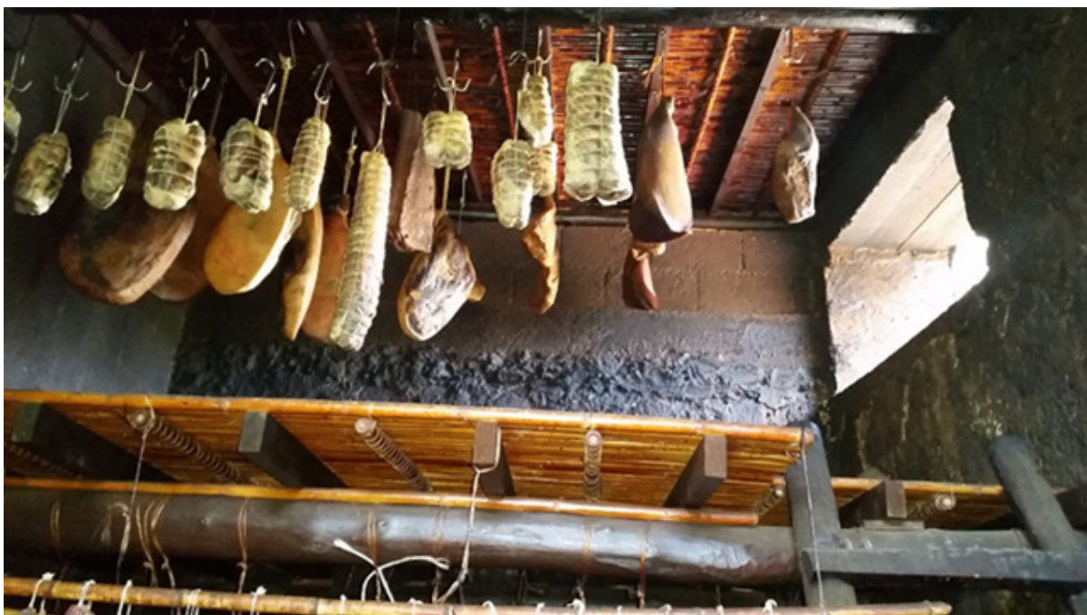
Imagen 6 – Autoproducción de fiambres y embutidos

Fuente: D.Farinella, granja de Bonacardo, centro-oeste de Cerdeña, abril 2015