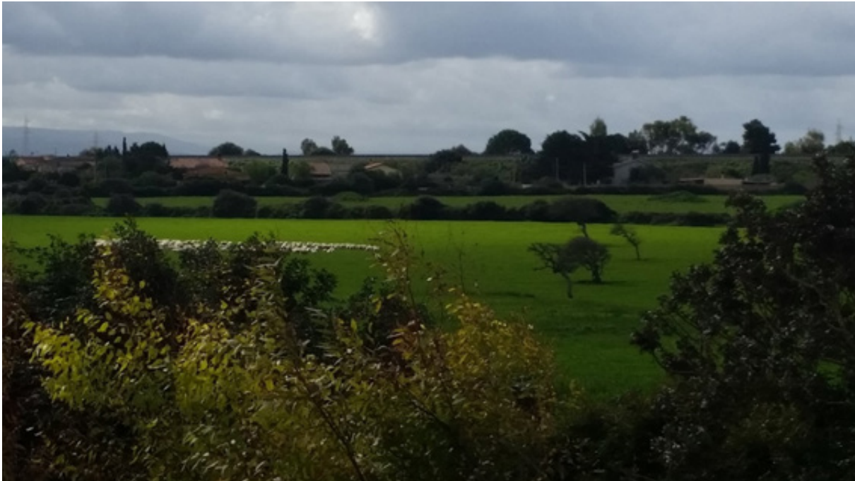
Imagen 4 – Ovejas en un prado cultivado

Fuente: D.Farinella, Porto Torres, noroeste de Cerdeña, febrero 2016