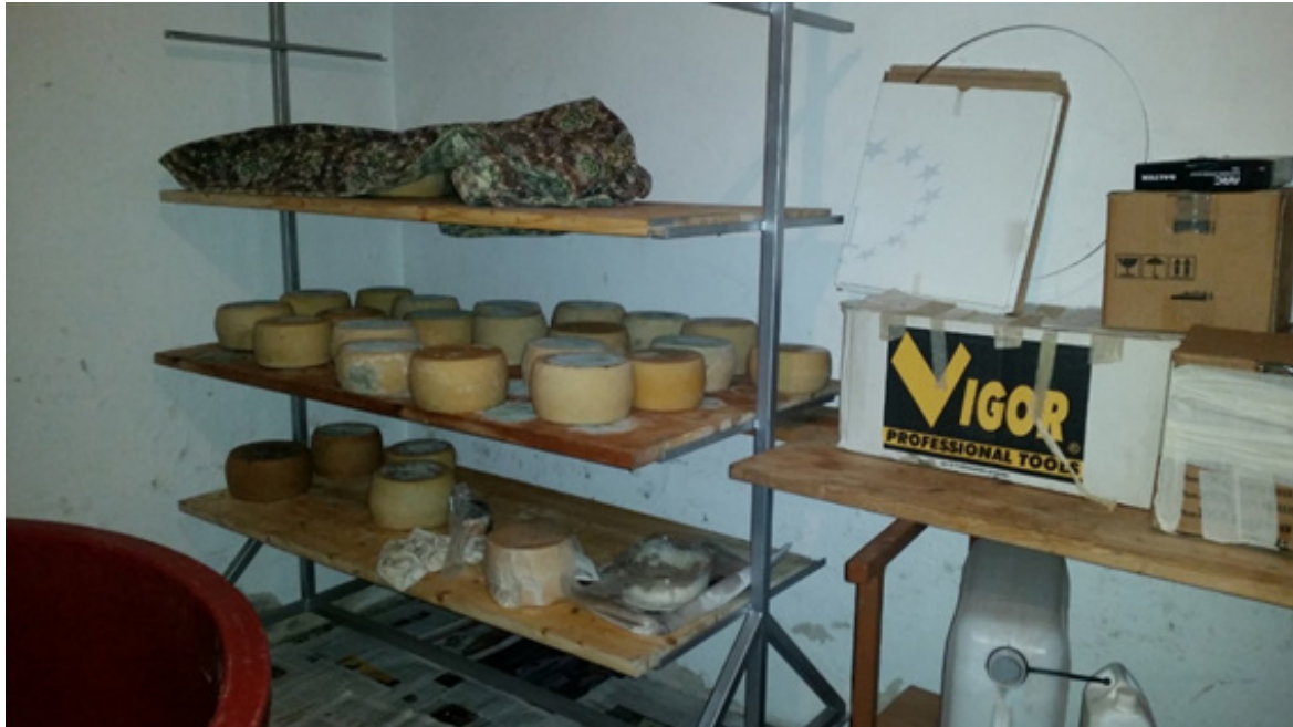
Imagen 8 – Producción de quesos para el autoconsumo

Fuente: D.Farinella, granja de Talana, centro-este de Cerdeña, marzo 2017