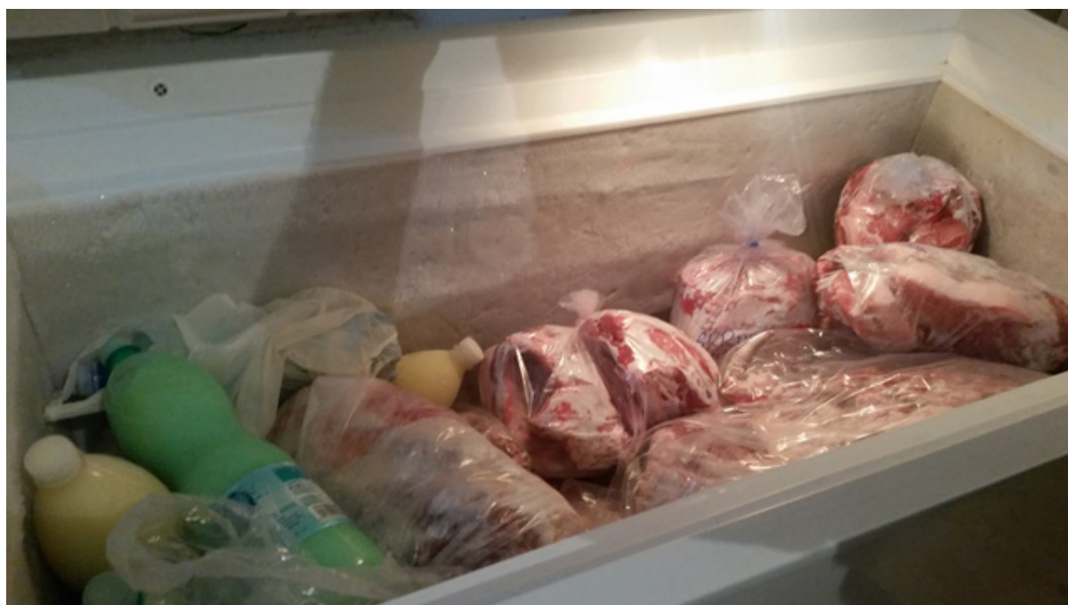
Imagen 7 – Provisiones de carne de varios tipos

Fuente: D.Farinella, granja de Bonacardo, centro-oeste de Cerdeña, abril 2015