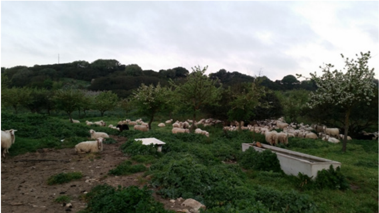
Imagen 2 – Ovejas en pastos naturales

Fuente: D.Farinella, granja de Orotelli, centro de Cerdeña, abril 2017