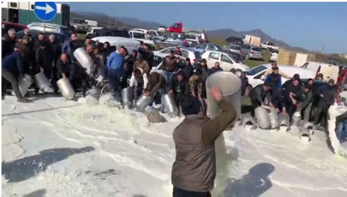
Imagen 1 – Los pastores tiran la leche a modo de protesta, febrero 2019

la industria). Las imágenes dan la vuelta al mundo. Los pastores organizan protestas espontáneas frente a numerosas centrales lecheras industriales y en los cruces de las carreteras principales: ningún camión lechero ni partida de queso debe circular por la isla, la producción ha de estar bloqueada (Simula, 2019; Farinella, 2019).