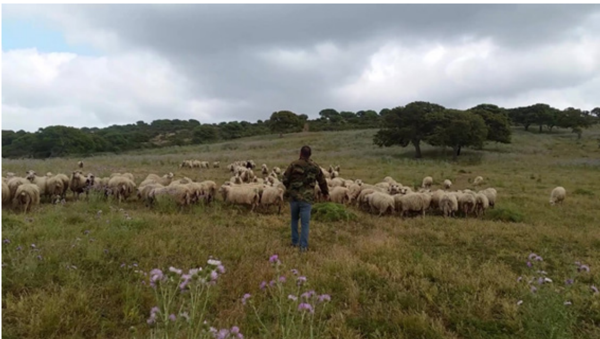
Imagen 3 – Pastor con ovejas en pastos naturales

Fuente: D.Farinella, granja de Orotelli, centro de Cerdeña, abril 2017