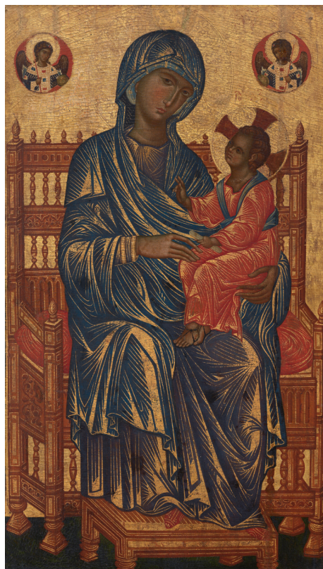
Figura 2. Madonna con Niño entronizados, temple sobre tabla, siglo XIII, 130,7 x 77,1 cm. National Gallery of Washington, n.º de inventario: 1949.7.1.

La subasta de 1919, en que se refieren a él solo con las palabras “ well-known connoisseur ”, y la de 1921, donde ya se hacen públicos su nombre y apellidos en la portada del catálogo para dotar de relevancia a los objetos subastados, dan a entender que, en muy poco tiempo, Herbert se hizo un nombre en el mundo artístico y cultural de Nueva York. Con relación a ello, tenemos constancia que empezó a trabajar tempranamente como marchante de arte ( art dealer ), aunque la única referencia documental que se conserva sobre su actividad como tal en Nueva York es de 8 de abril de 1920 cuando