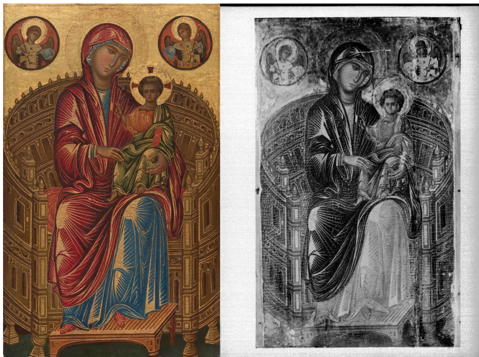
Figura 3. Izquierda: Madonna con Niño en trono curvo, temple sobre tabla, siglo XIII, 82,4 x 50,1 cm. National Gallery de Washington, n.º de inventario: 1937.1.1. Derecha: Madonna con Niño en trono curvo, Instituto del Patrimonio Cultural de España, fototeca, archivo Moreno, 07331_B.

que muchos coleccionistas, curiosos o directores de museos –españoles y extranjeros– pasaron por el establecimiento.